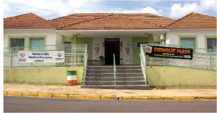
Centro de Saúde de Lupércio; no sábado, dia 8, unidades vão abrir para vacinação