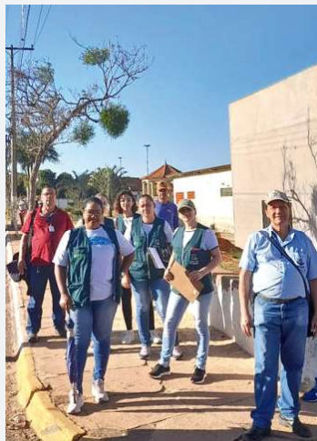
Agentes comunitários em Lupércio