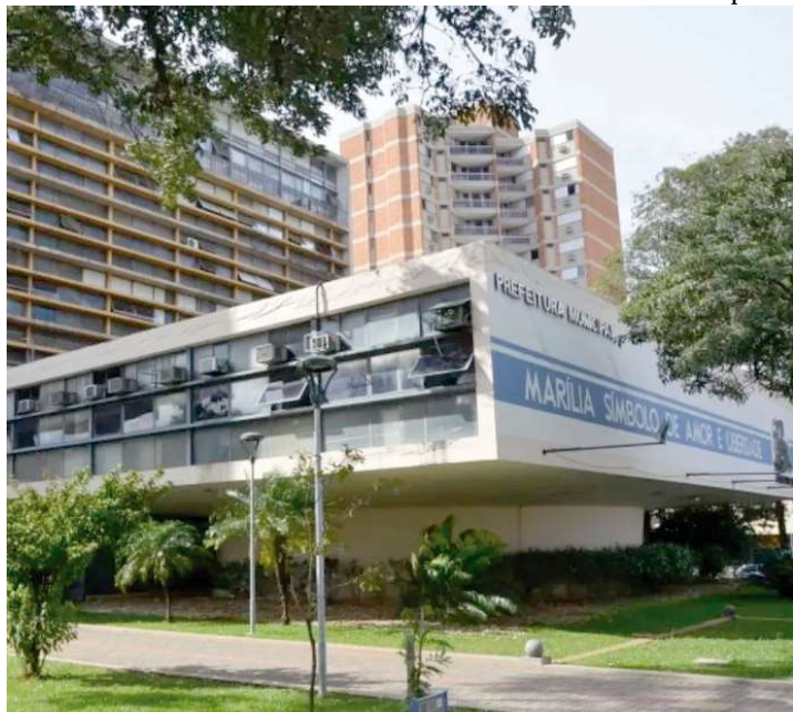
Ata da última reunião de pleno contém duras críticas e várias cobranças à gestão municipal