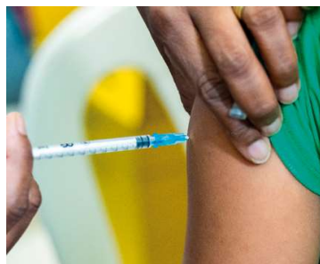
Campanha deve seguir até o final do mês