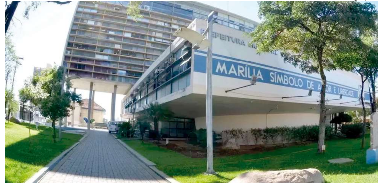
Ata da reunião foi divulgada por meio do Diário Oficial do Município de Marília