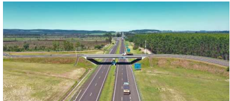
Ao menos duas cidades da região tiveram valores de pedágios atualizados nesta semana