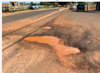
Buraco no asfalto da avenida Colombo