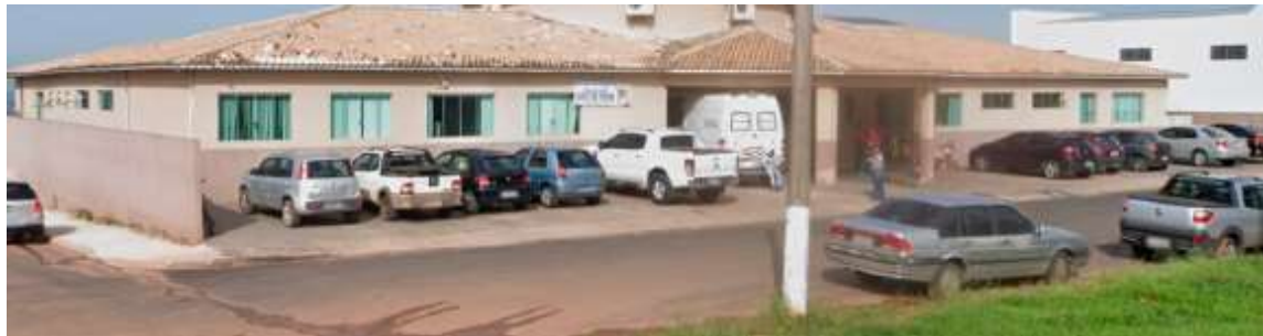
Centro de Saúde de Alvinlândia; aumento de casos de chikungunya e dengue acendem alerta para autoridades locais

EM PERÍODO DE CHUVA, É PRECISO FICAR ATENTO!