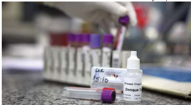
Número de pessoas diagnosticadas com a dengue tem grande salto em menos de um mês

Ubirajara também tem um óbito em investigação. No Painel de Monitoramento da Dengue chegou a constar uma morte confirmada pela doença, mas dias depois o caso foi retirado dos registros pela Vigilância Epidemiológica de São Paulo. A vítima seria uma ido-