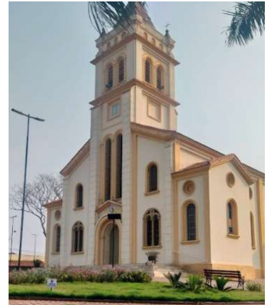
Vista da Matriz Santo Antonio de Ocaçu