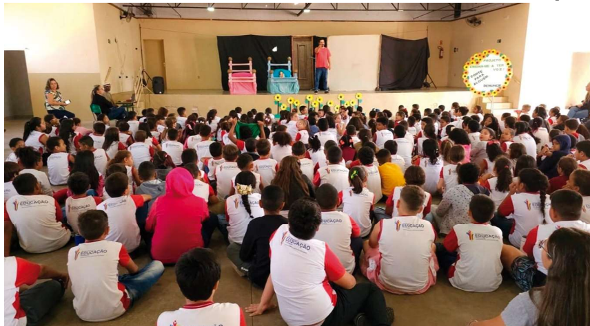
Dos 645 municípios do estado, apenas 76 conseguiram superar a meta estabelecida pelo governo