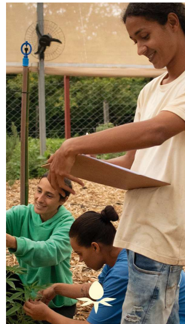
Evento conta com imersão sobre óleos