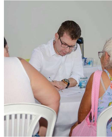
Fernando Itapuã no ‘Gabinete Itinerante’