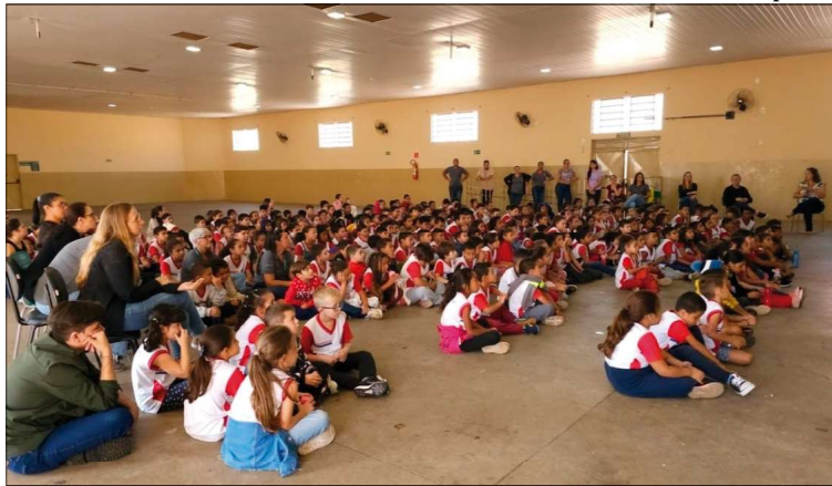
Estudantes participam de atividade na escola ‘Dona Maria Barbieri de Freitas’

Inep. Para 2024, a meta estabelecida foi de 60%. Já para os próximos anos os valores seguem da seguinte maneira: 2025 - 64%; 2026 - 67%; 2027 - 71%; 2028 - 74%; 2029 - 77% e 2023 - 80%.