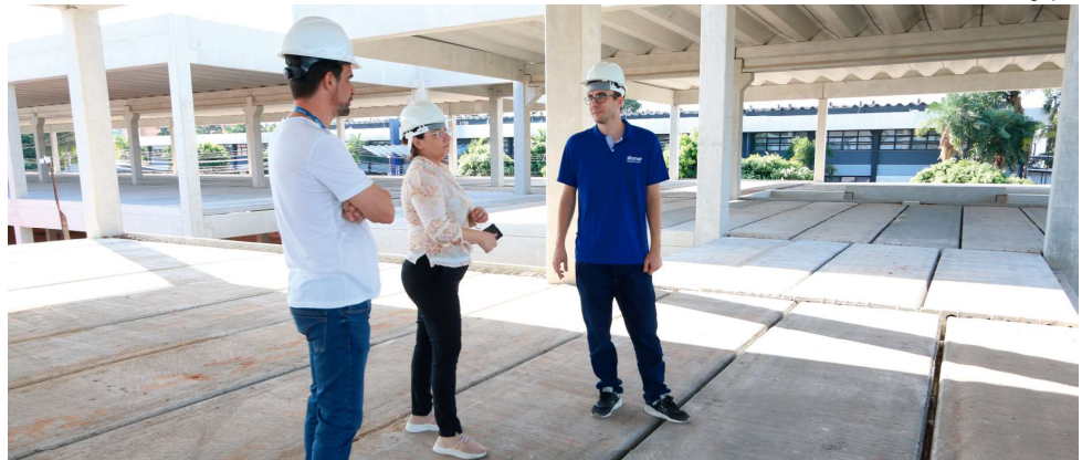
Evento será realizado no anfiteatro da universidade e recebe toda a comunidade; já são 15 empresas instaladas na instituição