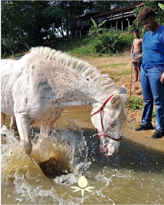
'Imersão Vet' é organizada pela Associação Canábica Maria Flor