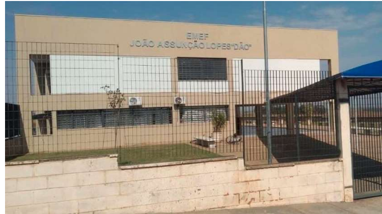
Rede municipal de ensino de Queiroz conquista 94,2% no índice de alfabetização