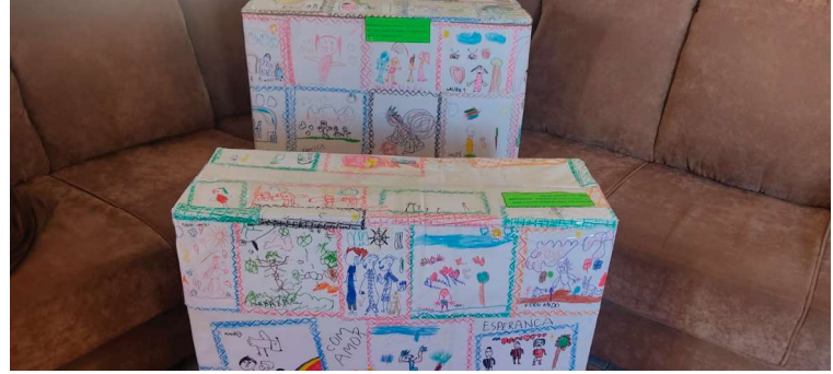
Doação de brinquedos para crianças do Rio Grande do Sul feita por alunos