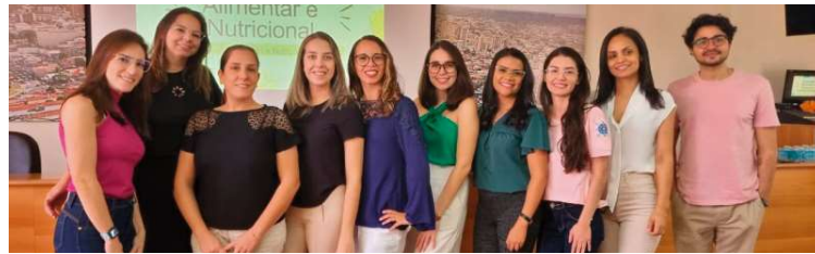
Equipe do município durante lançamento do Protocolo de Seletividade Alimentar