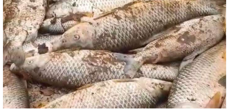
Diversas espécies de peixes foram encontradas mortas no rio Tibiriçá, em Queiroz

Técnicos da Cetesb e policiais ambientais estiveram no dia 27 de maio em Queiroz, coletando amostras da água do rio Tibiriçá. O estudo verificou se houve despejo irregular de resíduos no rio, principalmente de compostos químicos líquidos. A Polícia Civil tam-