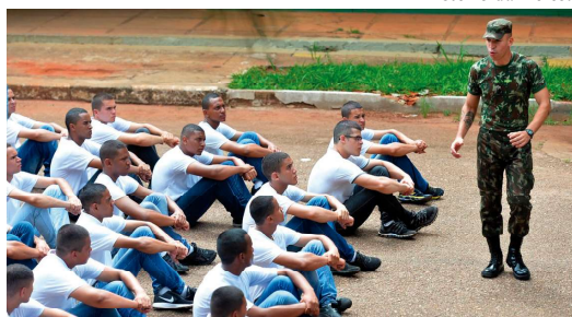
Deve cumprir a obrigação quem completa 18 anos em 2024

Jovens de Pompeia devem se alistar até o final do mês na Junta Militar ou no site P4