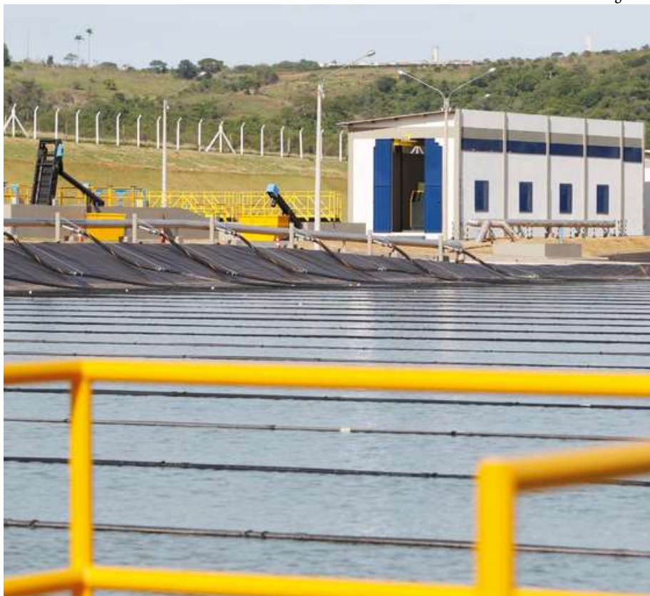
Contratação da Replan para operação e manutenção das estações de esgoto termina somente em 2025