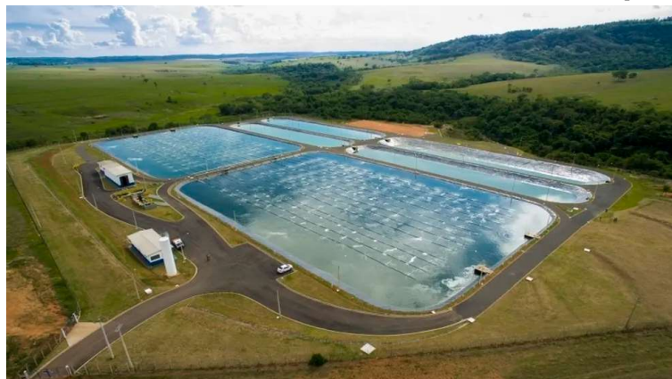
O valor total do contrato já ultrapassa a casa dos R$ 15 milhões, com aditivos