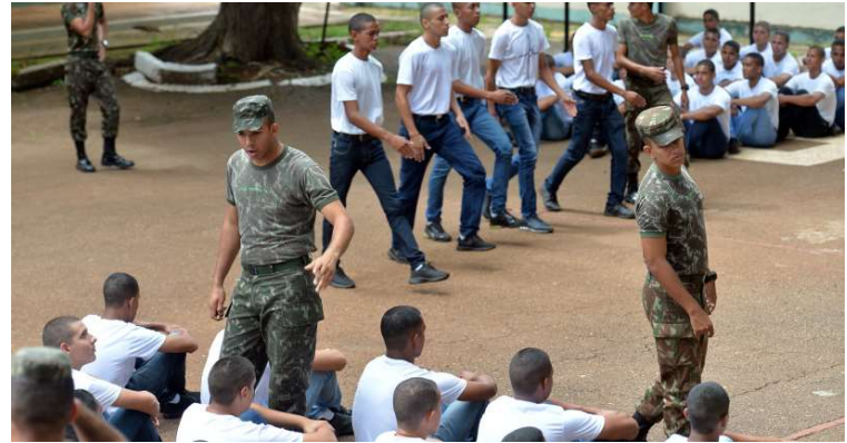
Jovens durante processo de seleção geral; prazo para alistamento está acabando