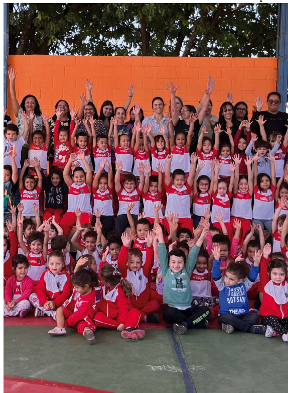
Projeto foi desenvolvido no Cemei 'Sonho de Criança', junto ao pré 1