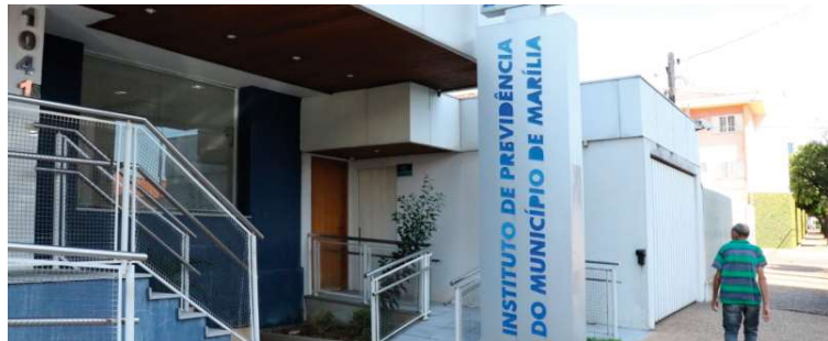
Vista do Ipremm, instituto de previdência, que teve as contas de 2022 rejeitadas

Além da rejeição do balanço, o auditor determina à prefeitura que adote medidas para regularização da aplicação dos recursos do RPPS (Regime Próprio de Previdência Social), gerido pelo Ipremm, sob os aspectos orçamentário e financeiro para que se evite a destinação indevida de receitas. “E quando da celebração de eventuais acordos de parcelamento, atente-se para o fato de que, mesmo que relacionadas à falta de aportes para a cobertura da insuficiência financeira do plano financeiro, tendo havido consumo indevido de recursos do plano previdenciário para contornar essa omissão, as quantias