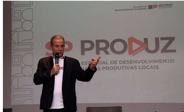
Programa de Desenvolvimento das Cadeias Produtivas Locais será apresentado