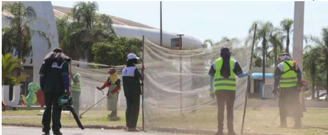
Contratação de R$ 19,8 milhões prevê capinação, roçada, varrição, manutenção de jardins e pintura de guias em Marília

Isso porque, em novembro de 2023, a Secretaria Municipal de Limpeza Pública rescindiu o contrato, de forma “amigável”, conforme consta em documento, com a Conservita Gestão e Serviços Ambientais Ltda., empresa que realizava os serviços desde 2019. O valor do contrato