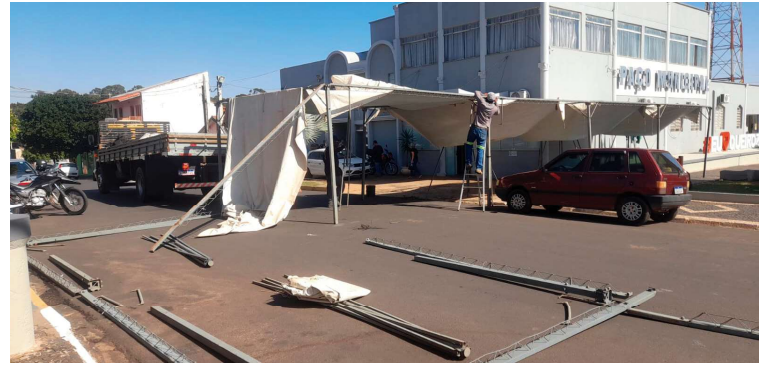
Organização montou estrutura durante a semana na Praça Central, ao lado do Paço