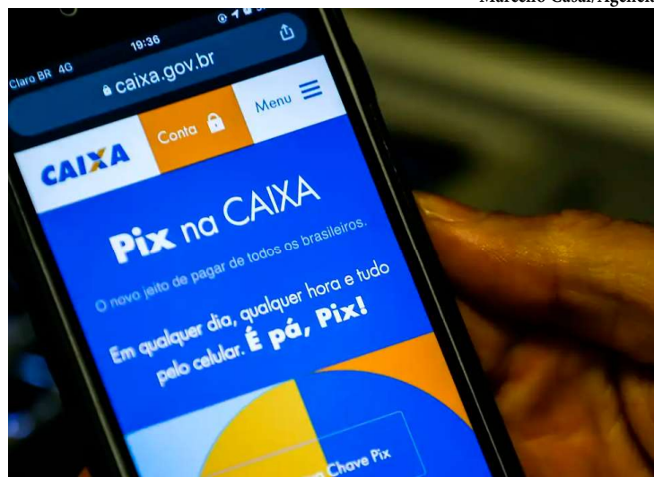
Limite de transação será de R$ 200 em celular não cadastrado; BC fez o anúncio

O objetivo é minimizar a probabilidade de fraudadores