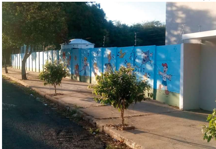
Advogado afirma que diretoria foi afastada de forma arbitrária pela prefeitura