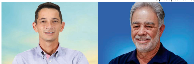
Convenções para lançamento oficial dos nomes devem ser realizadas na próxima semana