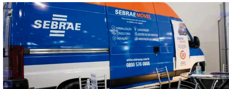
Atendimento no Sebrae Móvel; Lupércio recebe van equipada no próximo dia 26