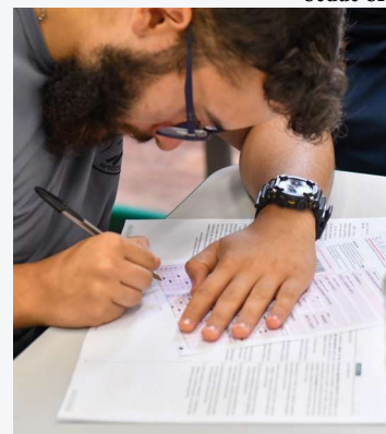
Alunos da região podem fazer a prova