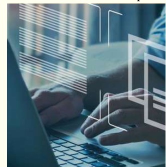
Candidatos devem fazer cadastro