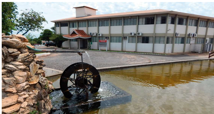
Fatec de Pompeia está com processos seletivos destinados à contratação de professores

CRONOGRAMA /Na próxima segunda-feira (29), a partir das 15h, será divulgada a lista de aprovados na 2ª chamada do vestibular da Fatec e também a abertura do prazo para o envio dos documentos dessa nova convocação. No dia seguinte, terça-feira (30), será o dia para fazer as matrículas. E na quarta-feira (31), as Faculdades de Tecnologia vão fazer a divulgação das inscrições deferidas e indeferidas na 2ª chamada.