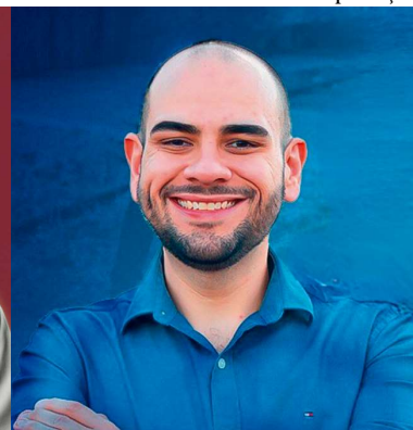
Vinho tem experiência de três mandatos no Executivo e Ceschim foi o vereador mais votado de Pompeia