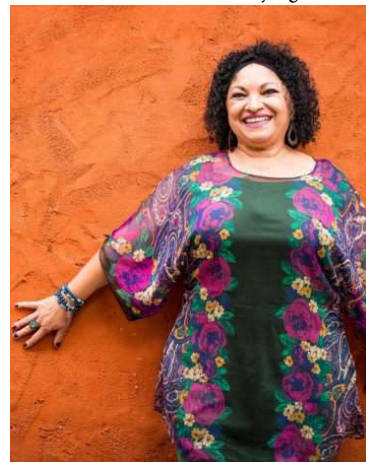
Artista apresenta ‘Sou Diana do Sertão’

Teste, Compare & Comprove que um Volkswagen+