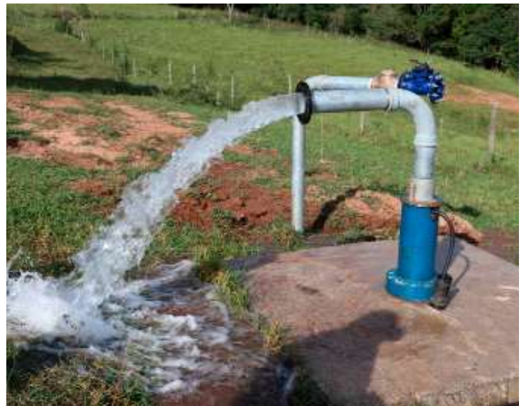
Comissão Julgadora aprovou as condições oferecidas pelo consórcio Ricambiental