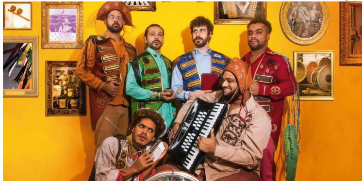
Projeto Beatles Cordel revisita canções dos Beatles através da cultura popular nordestina