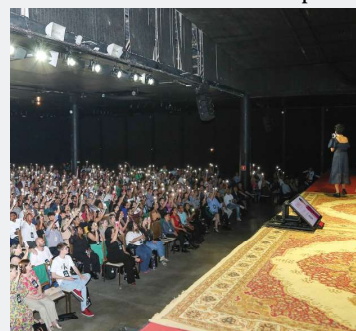
Registro de evento anterior da Acim