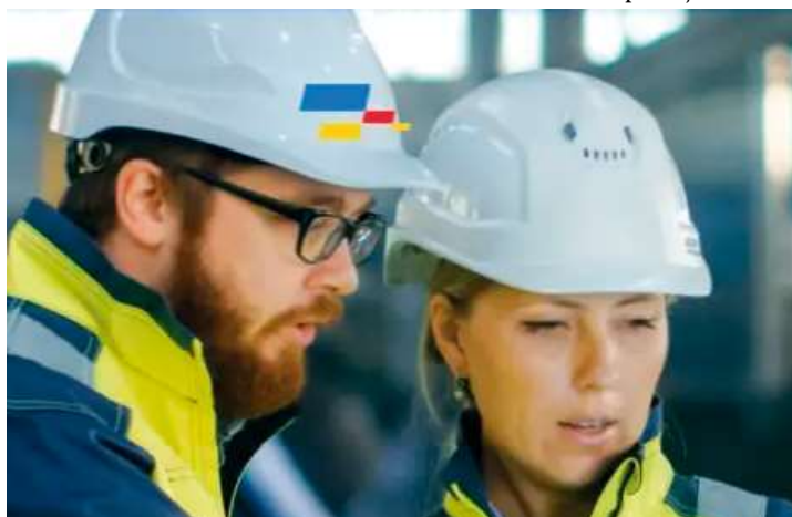
Sebrae abre inscrições para programa de acompanhamento de pequenas empresas