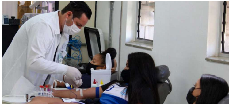
A entidade vem publicando nas redes sociais apelos à comunidade para doação de sangue

De acordo com levantamento, os estoques de sangue tipos AB – e B- já estão zerados, e o tipo A- tem apenas 32%. A falta de sangue afeta diretamente não somente a população de Marília, mas toda a região Oeste e Centro Oeste do estado de São Paulo, atendendo uma