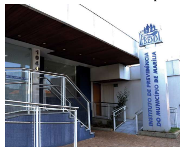
Acordo foi publicado no Diário Oficial