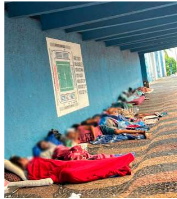
Pessoas em situação de rua em Marília