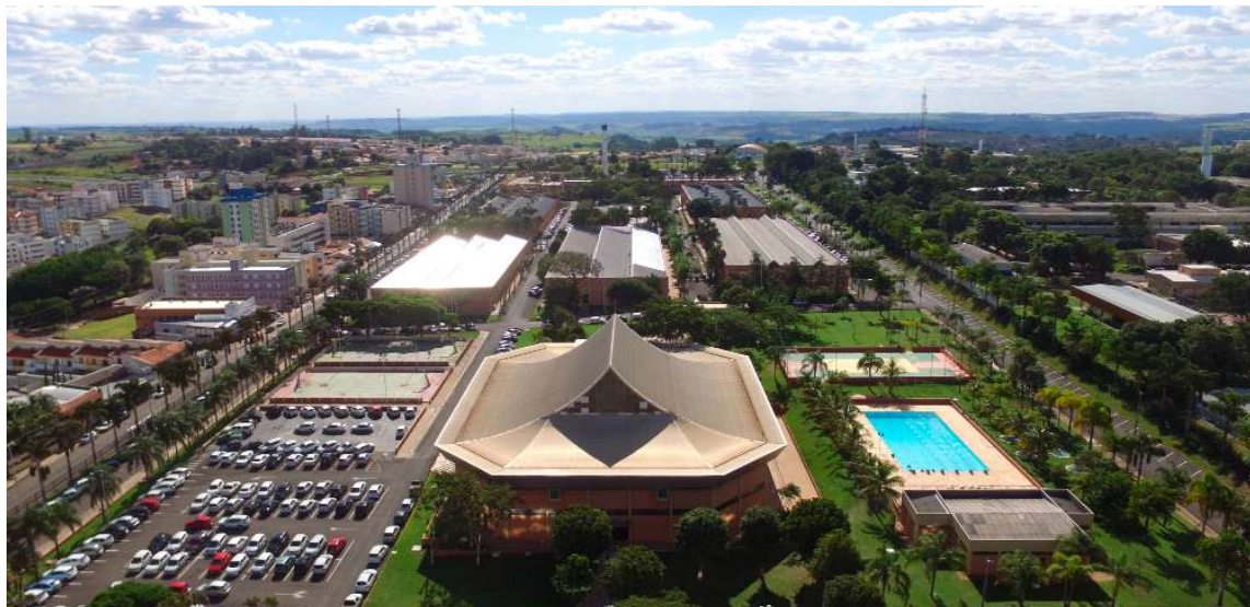
Dois novos cursos integram o portfólio: Bacharelado em Inteligência Artificial e Tecnólogo em Design Gráfico