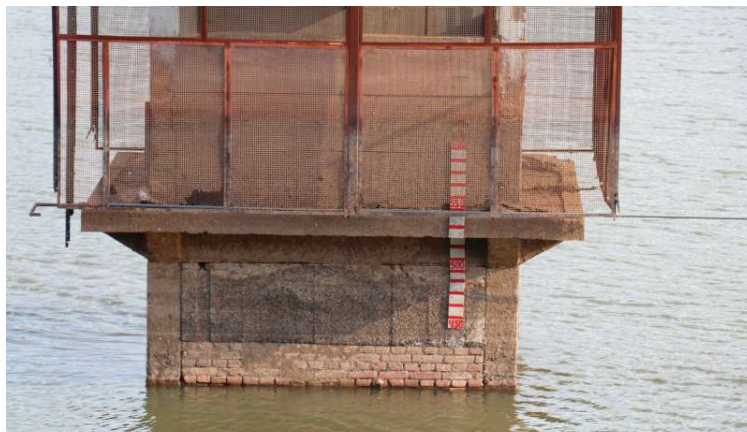
Prefeitura emitiu comunicado no último mês sobre o risco no nível da represa Cascata

De acordo com o Ciiagro (Centro Integrado de Informações Agrometeorológicas de São Paulo), a cidade está com estiagem há 17 dias. A última chuva registrada pelo órgão foi no dia 10 deste mês, com apenas 15 milímetros de água. E essa falta de mudança no tempo tem contribuído para o índice de umidade relativa do