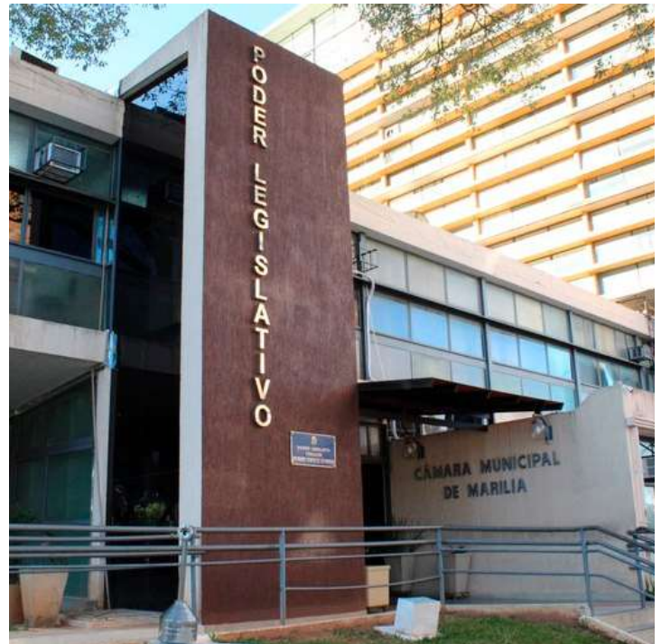
Fachada do Legislativo mariliense; projeto foi apresentado em caráter de urgência