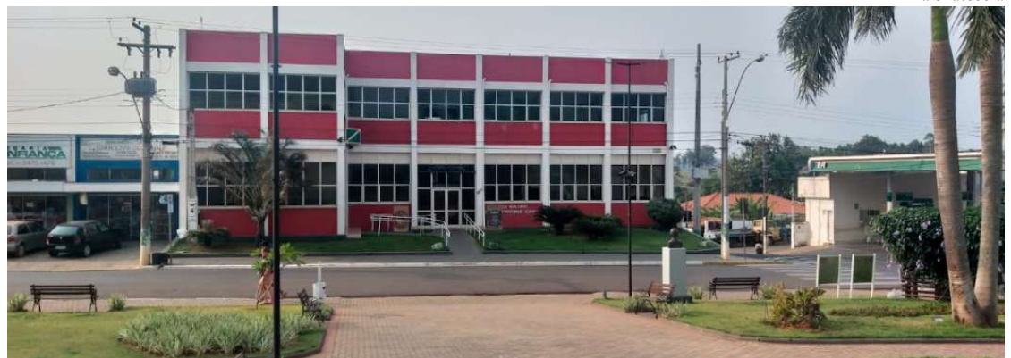
Vista da Prefeitura Municipal de Ocaçu; cidade terá dois candidatos na disputa pelo Executivo nas eleições de outubro

Na semana passada, anunciaram que a Federação PSDB/Cidadania fará parte da coligação, que já conta o PSD e PP. A convenção está agendada para ter início às 19h, no Barracão, que fica na BR-153, quilôme-