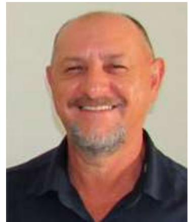
Kito venceu as duas últimas eleições