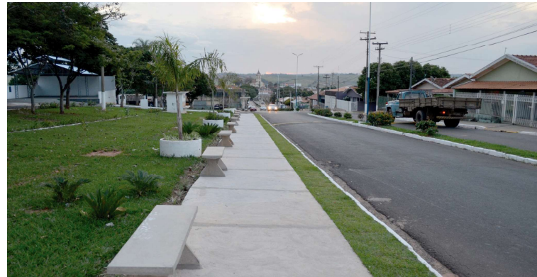
Praça em frente ao Cemitério Municipal; edital prevê instalação de câmera no local