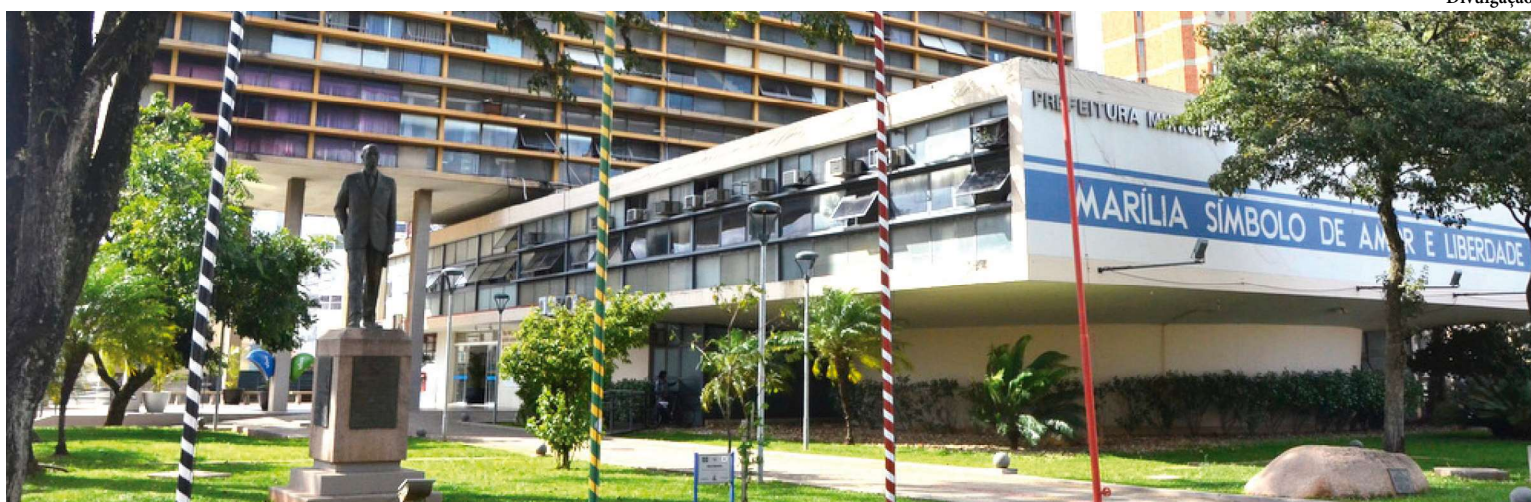
Prefeitura antecipa feriado de São Bento e, junto a secretarias municipais, Ganha Tempo, Procon, Museu de Paleontologia e Galeria de Artes, só retoma o expediente na próxima quarta-feira, dia 10

Comércio pode abrir no feriado, mas lojistas precisam cumprir regras P5