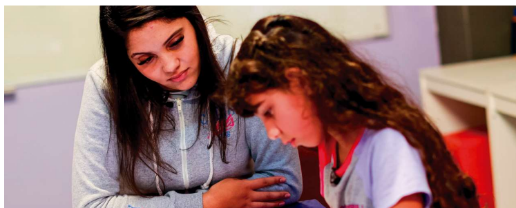
Foi publicado no diário oficial edital de abertura para contratação de professor tutor