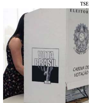
Maioria do eleitorado é do sexo feminino

Todas as estatísticas do eleitorado mariliense podem ser conferidas no site do TSE ( www.tse.jus.br ) no link Eleições e depois Estatísticas.