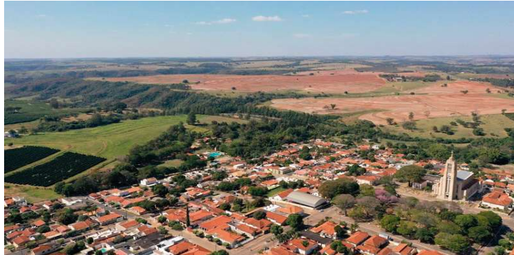
Vera Cruz decretou situação de emergência em março; seca tem causado prejuízos

Além de fornecer equipamentos de combate aos incêndios, o Estado afirma que pretende garantir o fornecimento de água à população em períodos sem chuva. Outra medida de enfrentamento à estiagem é a campanha