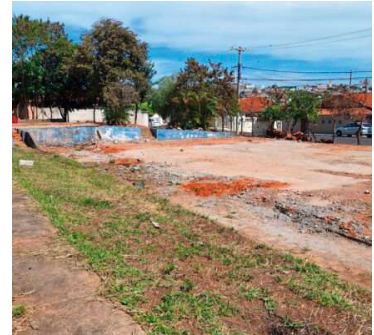
Poliesportivo foi demolido nesta semana