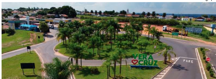
Meses sem chuva teriam atrapalhado o desenvolvimento agrícola da cidade e causado perdas na produção