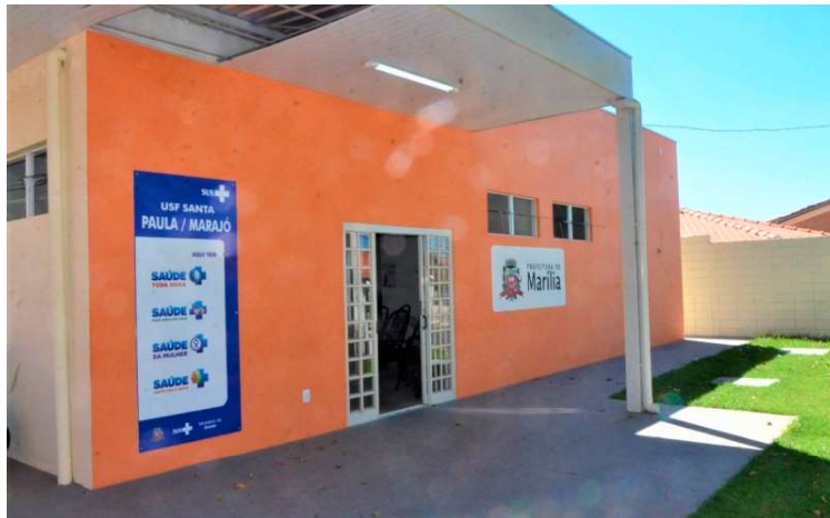
USF Santa Paula/Marajó é uma das unidades que absorveu atendimentos do bairro

A retomada dos serviços ocorre após a prefeitura convocar a segunda colocada no processo licitatório para a reforma, já que a primeira pediu rescisão do contrato por questões logísticas. “Alegando falta de logística na cidade, a empresa WAG-X, com sede em São Paulo e filial em Ribeirão Preto, não concluiu as obras e