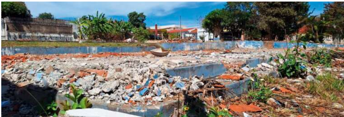
Representações da Matra motivaram uma ação civil pública ajuizada pelo Ministério Público; decisão da Justiça é de maio de 2022