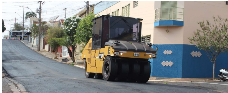
Imagem de serviço de recapeamento em via de Marília; aditivo encarece atual contrato

Entre as ruas e avenidas listadas para receberem as melhorias do programa chamado de “Marília em Ação”, estão trechos da República, Santo Antonio, das Esmeraldas, Presidente Roosevelt, Washington Luiz, João Martins Coelho, João Ramalho, Monte Carmelo, Paraná, Paulicéia, Nove de Julho, Pedro de Toledo, das Gardênias, e outras. “As ruas e avenidas selecionadas atuam como importantes vias coletoras, sendo caracterizadas pelo alto fluxo de veículos em seus respectivos bairros. Além disso, o pavimento dessas vias encon-