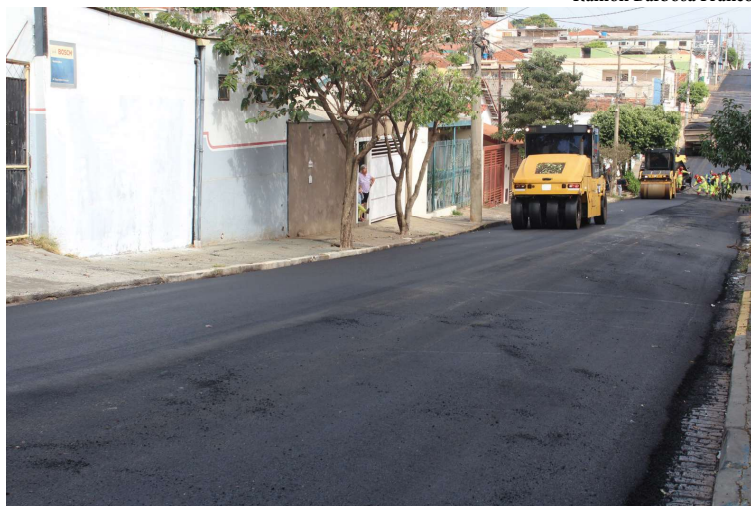
Diversas ruas e avenidas devem ser contempladas; contrato inicial era de R$ 13,2 milhões