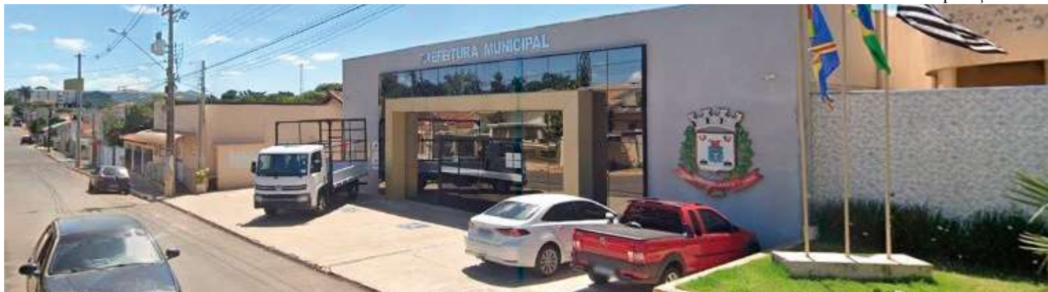
Prefeitura de Herculândia aponta na justificativa do processo que o atendimento adequado às necessidades nutricionais dos pacientes do município é indispensável