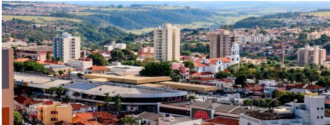
Vista de Marília; cidade caiu em ranking que avalia a competitividade de mais de 400 municípios com mais de 80 mil habitantes

O levantamento analisa 411 municípios brasileiros (7,45% do universo nacional), representando os com população acima de 80 mil habitantes de acordo com a estimativa do IBGE (Instituto Brasileiro de Geografia e Estatística) para o ano de 2021. São avaliados 65 indicadores, organizados em 13 pilares temáticos e três dimensões: instituições (sustentabilidade fiscal e funcionamento da máquina pública);