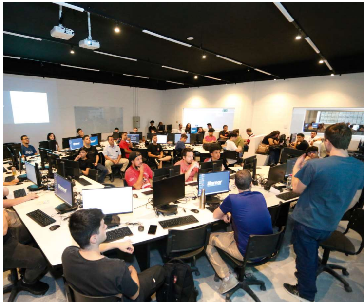
Formação combina teoria e prática, com acesso a laboratórios de última geração

Segundo um estudo realizado pela Brasscom (Associação Brasileira das Empresas de Tecnologia da Informação e Comunicação), o mercado de tecnologia brasileiro demandará cerca de 420 mil novos profissionais até 2025,