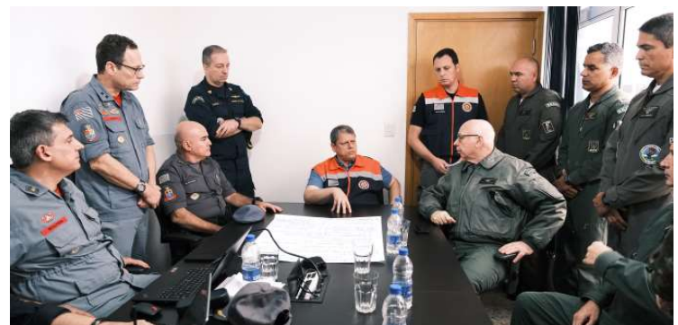
Gabinete de crise para coordenar as ações de combate às queimadas foi criado em SP