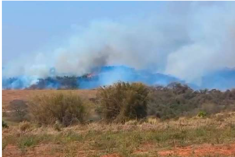
Área com queimada em Paulópolis; Quintana ajudou no combate aos focos de fogo

Além de encaminhar ajuda extra para Pompeia, Quintana colocou telefone da Santa Casa do município à disposição para a comunicação sobre a ocorrência de novas queimadas. A ideia é que a comunicação seja rápida para um controle mais efetivo dos focos. “O telefone da Santa Casa funciona por 24 horas e