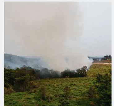
Homem ateou fogo em uma lavoura