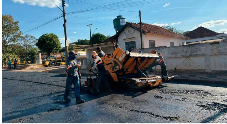
Ação de recapeamento asfáltico continua em Vera Cruz; nova licitação chegou a ser suspensa

No portal da transparência do município, a reportagem do O DIA apurou que o registro do processo licitatório está atualizado no sistema, mas até essa sexta-feira (30) não haviam documentos, principalmente o edital, ane-