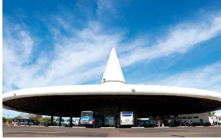
Imagem da Rodoviária de Marília; prefeitura transfere administração à Emdurb

No texto, todos os bens integrantes dos cemitérios e da rodoviária serão transferidos para a Emdurb, assim como os contratos em vigor. A transição da administração entre prefeitura e Emdurb implicará