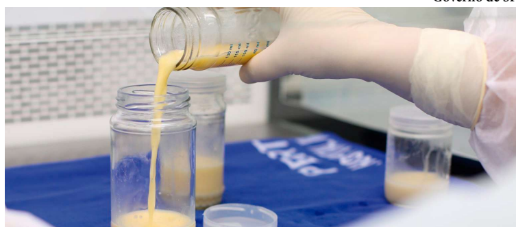
Banco de Leite de Marília disponibilizou quase 407 litros de leite humano até julho