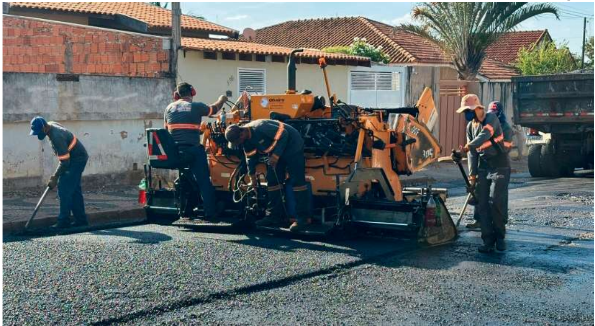
Licitação para recapeamento de vias que havia sido suspensa já está marcada para o próximo dia 3; valor contratual estimado é de R$ 531 mil