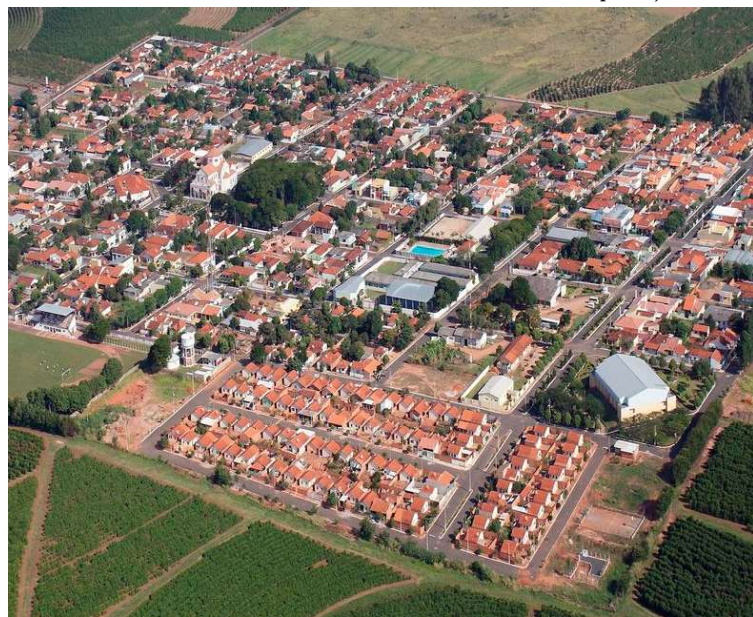
Vista aérea de Lupércio, município que recebeu mais recursos do ICMS até julho