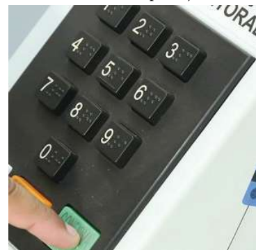
Convenções definiram pré-candidatos