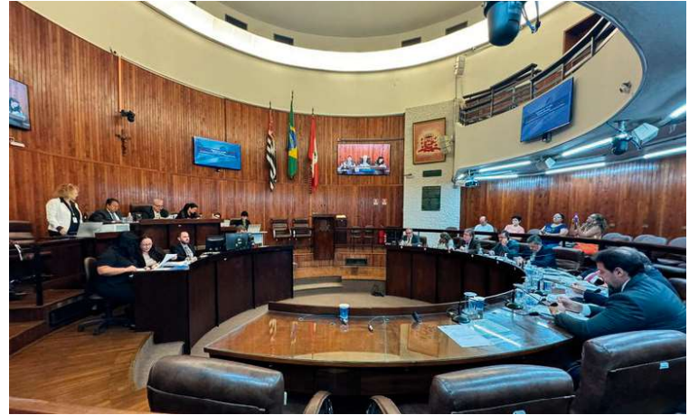
Texto foi aprovado em primeira votação e permite ao município estabelecer convênios