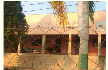
Aulas ocorrem no Centro Comunitário