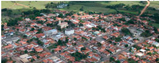
Vista de Ocaçu, município que possui 3.450 eleitores aptos à votação