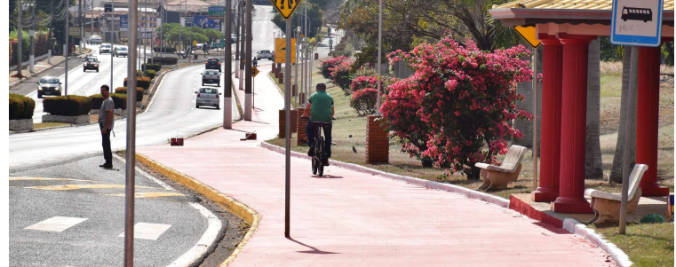
Vista de Pompeia, que conseguiu gerar mais empregos no primeiro semestre deste ano

Este ano, o mês com o maior saldo do emprego formal foi maio, com 66. Já o pior resultado é o de abril, que fechou no negativo, com menos uma vaga. No sexto mês, último disponível na base de dados do Caged, Pompeia apresentou saldo de apenas 14 postos celetistas, contudo ainda é melhor que de junho do ano passado, quando resultado foi de -42. Somente a indústria obteve saldo positivo no sexto mês em 2024.