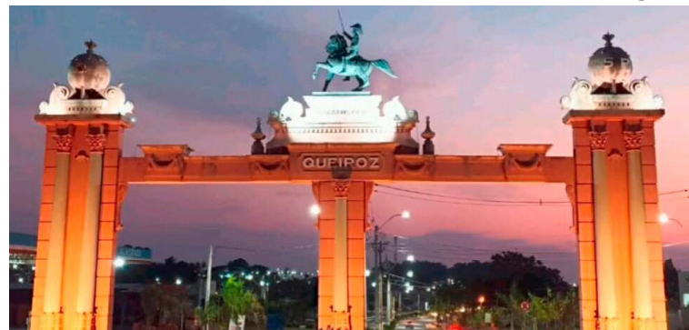
Tica é o escolhido pelo MDB e tentará pela quinta vez ser prefeito de Queiroz