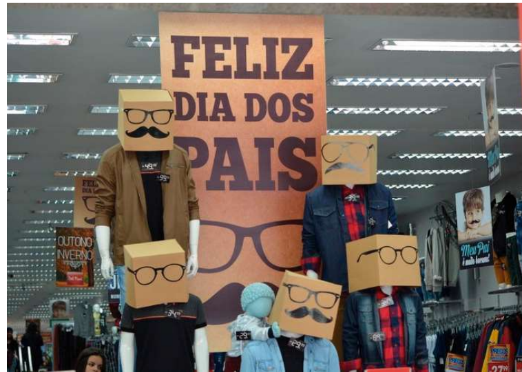
Lojas ficarão abertas nesta sexta-feira até a noite e, no sábado, durante a tarde

OFICIAL DE REGISTRO DE IMÓVEIS, TÍTULOS E DOCUMENTOS E CIVIL DE PESSOA JURÍDICA DA COMARCA DE POMPEIA-SP Rua Pedro Palone, nº 70 - Centro - CEP: 17.580-073 - Fone: (14) 3452-4065 e-mail:rimoveispompeia@ig.com.br