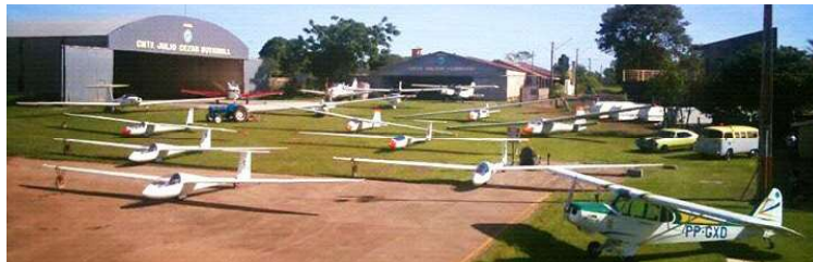
Aeroclub de Marília ocupa 5% da área total do Aeroporto Frank Miloye Milenkovich