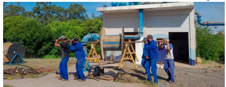
Para sindicato, fase de transição precisa de transparência, participação e garantias