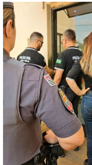
Três pessoas foram presas pelas equipes