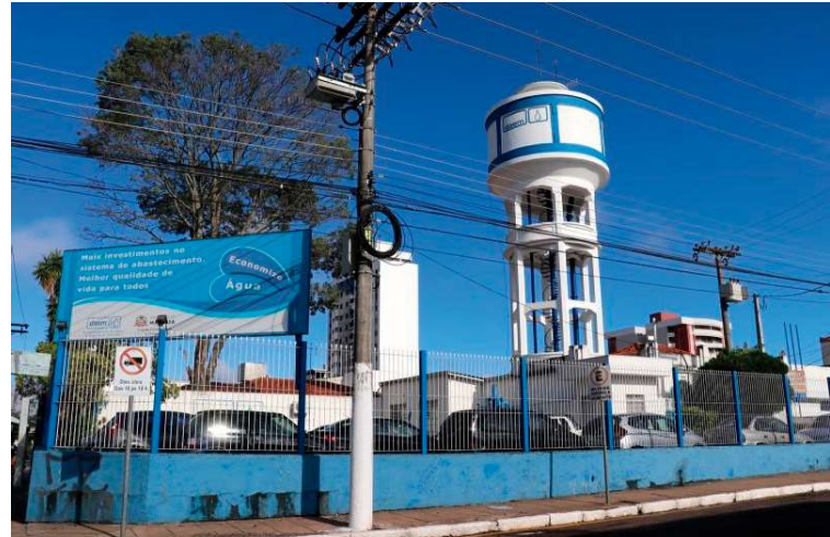
Ação movida pelo sindicato dos servidores públicos de Marília segue na Justiça