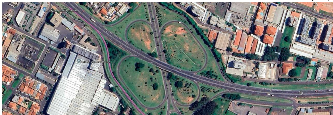
Trabalhos tiveram início nesta quinta-feira e os motoristas precisam ficar atentos às alterações no tráfego nos próximos dias