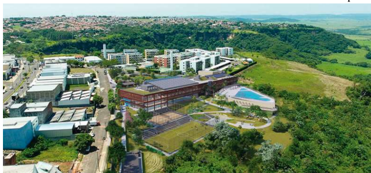
Projeto do Sesc de Marília, que concentra a maior parte dos investimentos anunciados na cidade