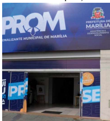
Inscrições devem ser feitas no Ceprom

EMPREGABILIDADE / O Centro Profissionalizante de Marília promove nesta sexta-feira, dia 9, ação de empregabilidade com entrega de currículos para uma rede de fast food com lojas em Marília, inclusive na região Norte. As vagas são para atendente de lanchonete.