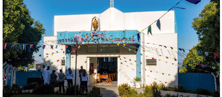
Capela Nossa Senhora das Graças, onde ocorrem as missas de abertura e encerramento

A programação segue com reflexão na Comunidade São Francisco, no dia 14, também às 20h, sobre "As redes sociais devem ser nossas amigas". No dia 15, na Capela São José, no