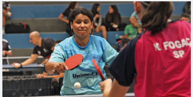
Competição realizada no ano passado; Marília é sede de etapa da disputa nacional