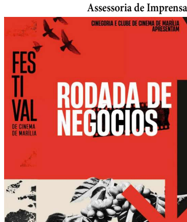
Cartaz divulga a Rodada de Negócios

O evento, que será realizado de forma online no dia 10 de setembro, às 14h, contará com a apresentação de propostas de longas-metragens, curtas e obras seriadas. Destaque para propostas de longas-metragens, tanto de ficção quanto documentário, que passaram por consultoria com conceituados roteiristas no CristaLab, laboratório de desenvolvimento de