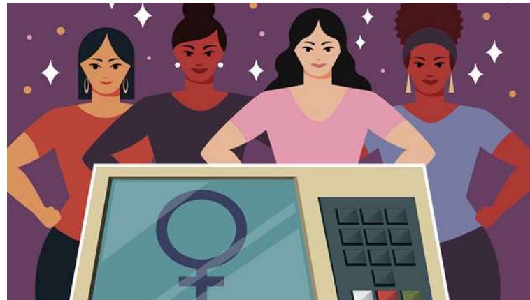
Percentual mínimo estabelecido pela regra eleitoral é de 30% para mulheres

Ilustração Thiago Fagundes/Agência Câmara