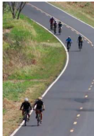
Imagem do trajeto onde ficará a ciclovia