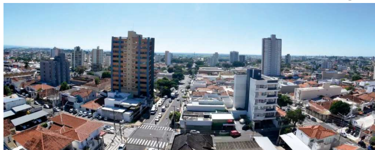
Censo de 2022 apontava 237.627 habitantes em todo o município de Marília

O CBO destaca que problemas oculares relacionados a tratamentos estéticos exigem avaliação oftalmológica de urgência quando surgem sintomas como dor na região ocular.