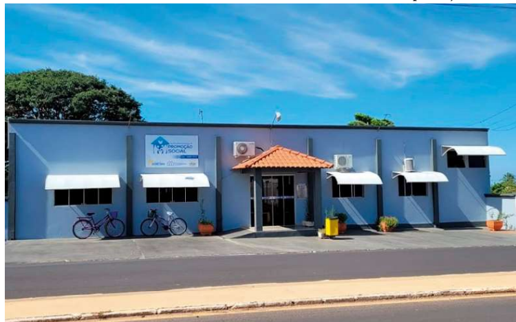
Secretaria de Promoção Social, onde o atendimento do Cras está sendo realizado

a iluminação no entorno do prédio do Cras também será melhorada, assim como a quadra esportiva. Os muros vão ser retirados e será implantado um estacionamento.