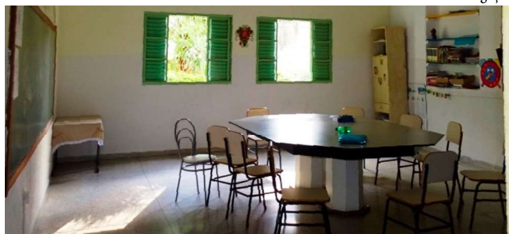
Associação Filantrópica de Marília foi a única interessada em chamamento