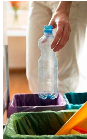
Serviço teve início nesta segunda-feira