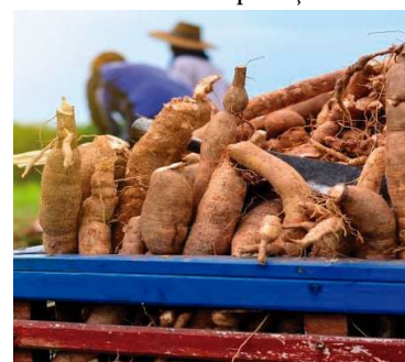
Produção de mandioca lidera na cidade