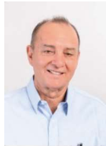
Manoel enfrenta pedido de impugnação