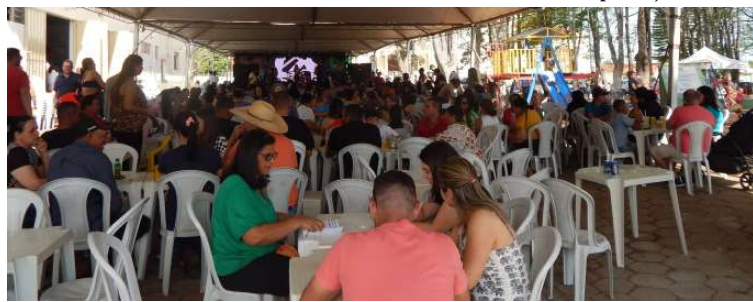
Festa do ano anterior; diversas atrações estarão disponíveis para a população