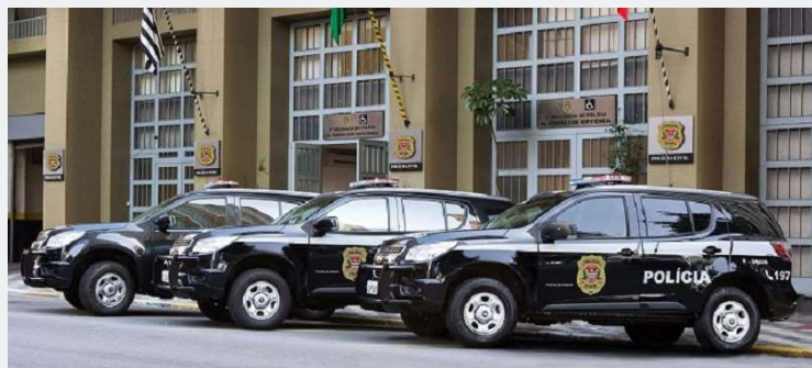
Com programa, policiais e agentes poderão morar mais perto do local de trabalho