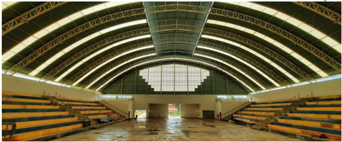
Imagem do ginásio coberto distribuída à imprensa pela prefeitura em maio de 2024; reforma começou em abril de 2022