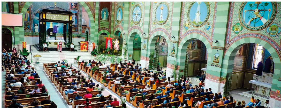
De acordo com o Santuário Sagrado Coração de Jesus, neste ano os moradores de Vera Cruz vivem as Santas Missões Populares