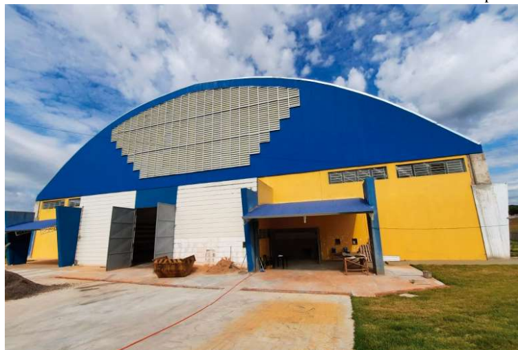
Centro Municipal Educacional, Esportivo e Cultural fica localizado na região Sul de Marília

Contrato com a executora da reforma teve início em março de 2022 e as obras começaram após um mês P5