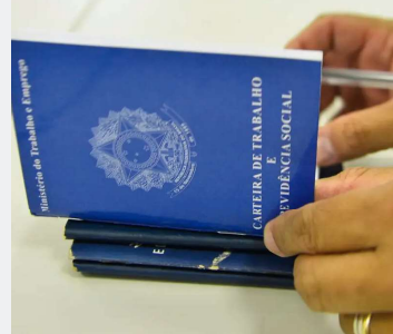
Total de trabalhadores atingiu recorde