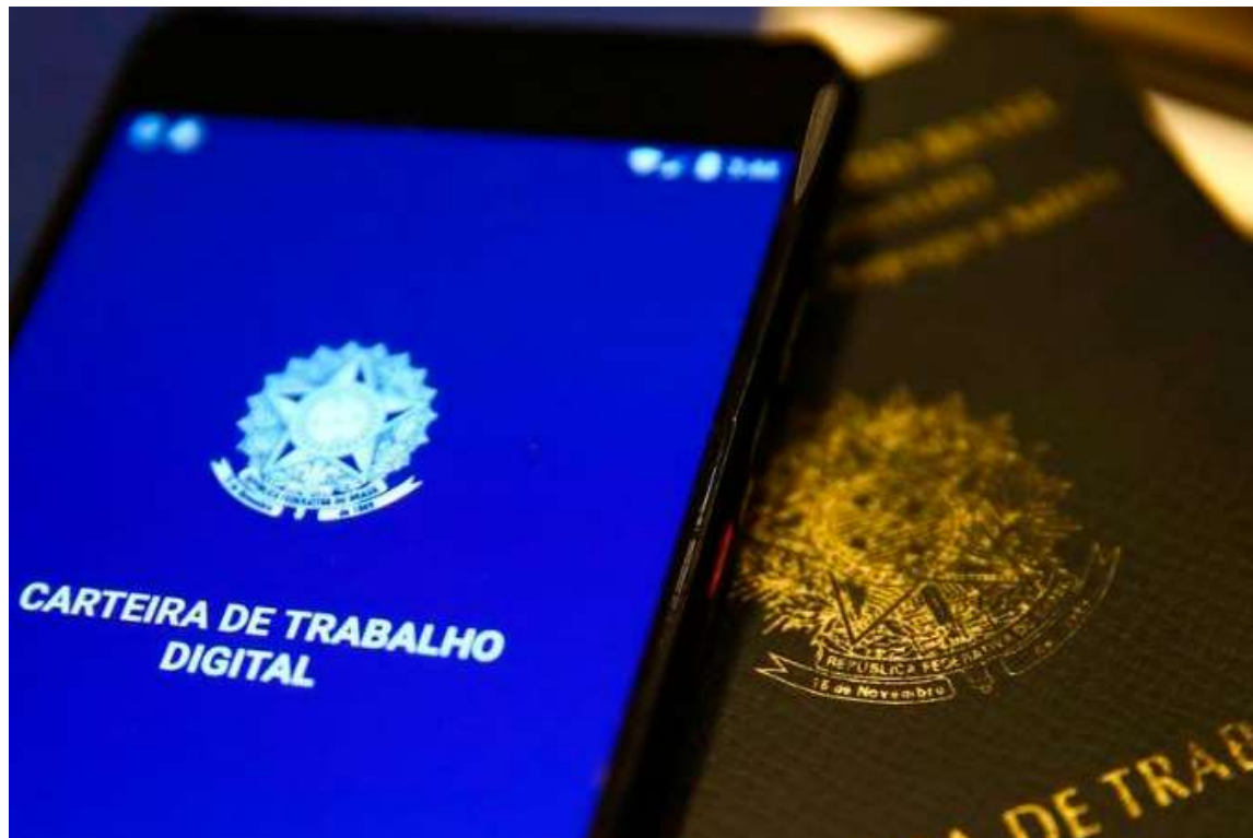
Carteira de Trabalho; cidade de Marília apresenta segundo melhor saldo do ano entre os municípios que têm mesmo porte