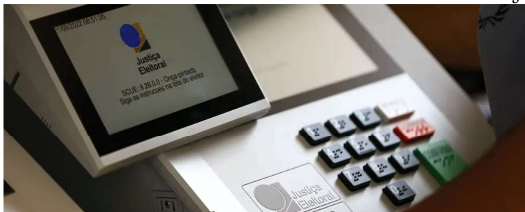
Eleitores não poderão votar em trânsito durante o pleito do dia 6 de outubro

Se ela for indeferida, será necessário quitar o débito com a Justiça Eleitoral. O histórico de justificativas eleitorais, com a respectiva eleição em que a pessoa se ausentou, também pode ser consultado no aplicativo.