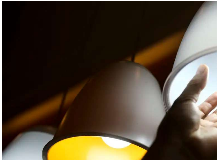
Baixa previsão de chuva motiva acionamento de bandeira de maior custo do sistema