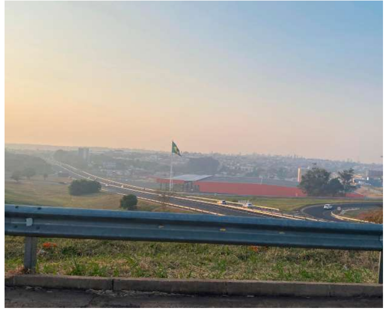
Marília encoberta por fumaça vista a partir da SP-333; ação alerta motoristas