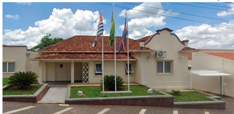
Prefeitura prepara LOA e pede sugestões para a população em formulário online