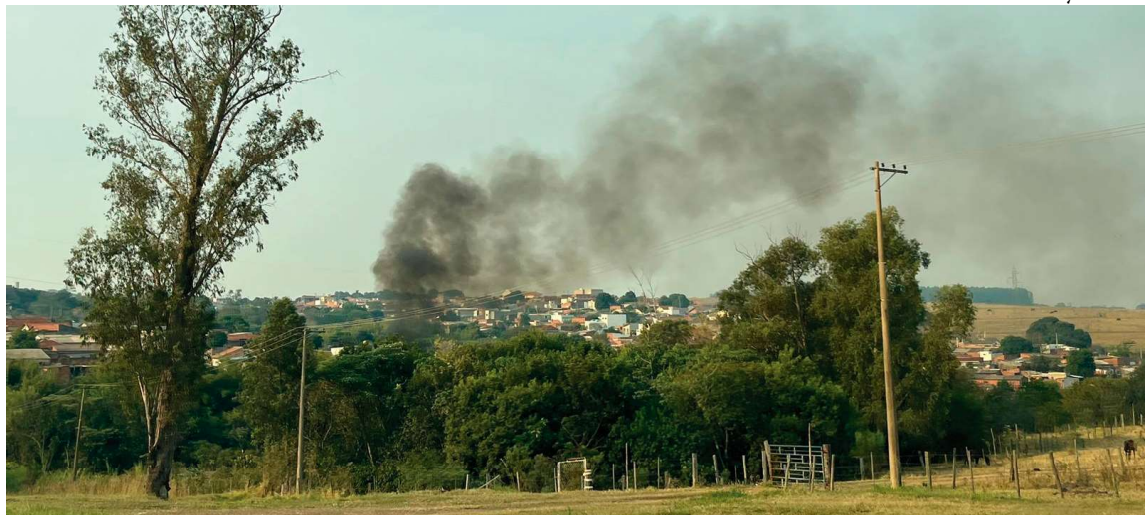
Registro de incêndio na região Sul da cidade; Cetesb confirma que o ar de Marília está com poluentes que podem ser inalados

De acordo com a aferição disponibilizada de forma online e também por aplicativo, Marília vem registrando longos períodos com o índice "ruim". Nessa quinta (5) e sexta-feira (6), por exemplo, a medição ficou acima dos 90 pontos e com o poluente MP10, o que significa partículas inaláveis em suspensão. Na rede automática são medidos os poluentes, além de parâmetros meteorológicos como direção e velocidade dos ventos, temperatura e