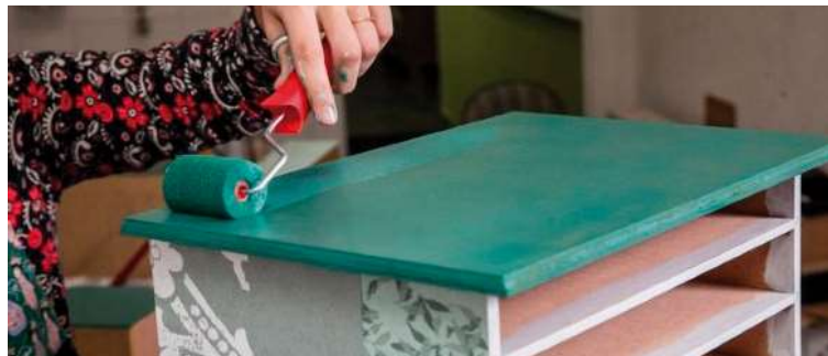
Pintura em MDF é uma das oficinas com inscrições abertas; prazo segue até sexta