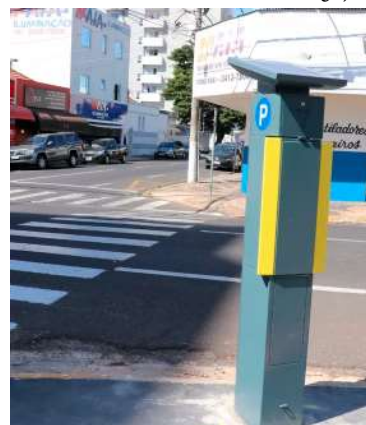
Rizzo iniciou processo de indenização