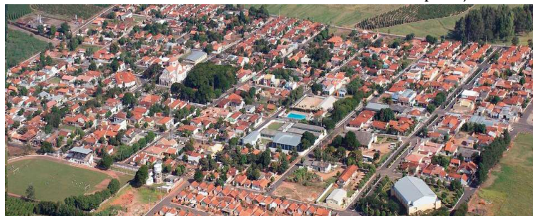
Vista aérea de Lupércio, cidade que tem 3,4 mil eleitores aptos para o pleito