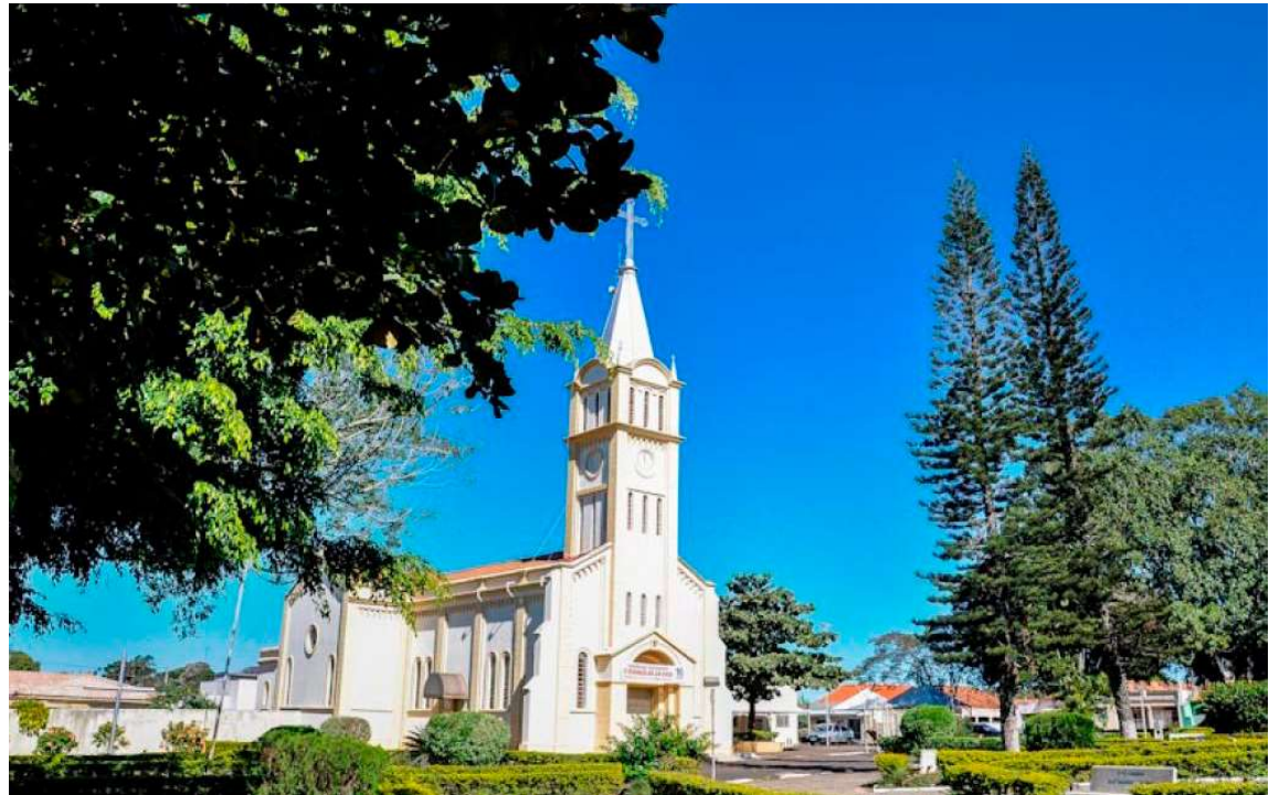
Reunião marcada para o dia 23 de setembro, na Câmara Municipal de Alvinlândia, deve ter a participação dos moradores

As prefeituras são obrigadas a organizar e realizar essas audiências públicas como cumprimento à Lei de Respon-