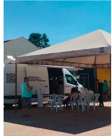
Projeto oferece serviços na Praça Central