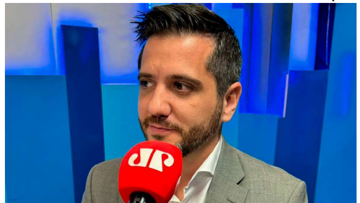
Advogado e especialista em direito eleitoral comentou situação em entrevista na Pan