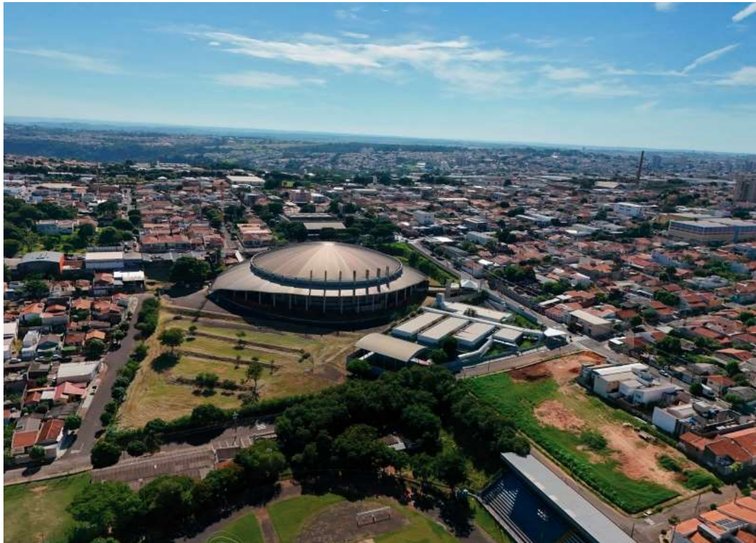
Vista aérea da cidade de Marília; empresa deverá fazer estudos e atualizar leis para garantir o crescimento ordenado do município