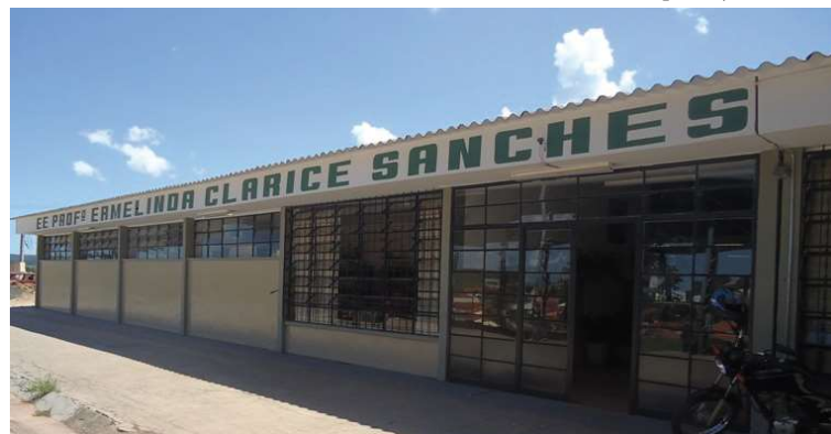
Escola estadual 'Professora Ermelinda Clarice Sanches' é um dos locais de votação