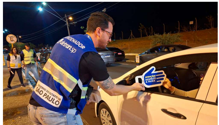
Ação terminou em 25 de setembro com o lema ‘Paz no trânsito começa por você’

de Fiscalização e Educação para o Trânsito do Detran-SP.