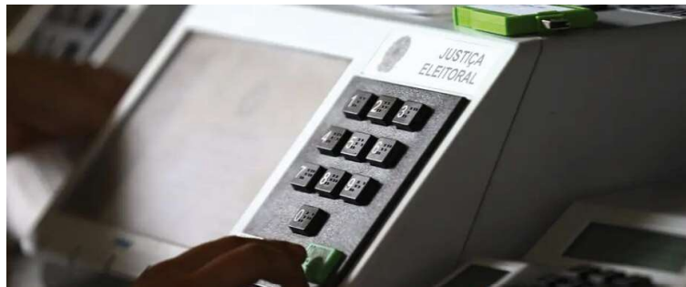
Pouco mais da metade do atual plenário da Câmara Municipal tenta se reeleger

É preciso lembrar que na escolha para vereador o que vale é o sistema proporcional de votação, que é utiliza-