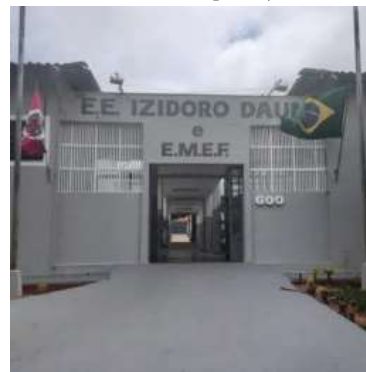
Escola Izidoro Daun receberá eleitores