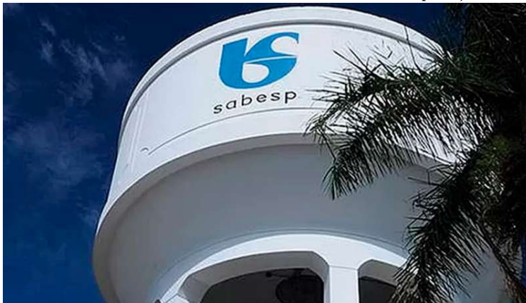
Com o FMSAI, Ubirajara passa a receber parte da receita operacional da Sabesp

A criação do Fundo é a regulamentação de uma nova fonte de recurso orçamentário, já que ela segue os critérios e as condições para o reconhecimento tarifário do repasse de parcela da receita direta dos prestadores, regulados pela Arsesp (Agência Reguladora de Serviços Públicos do Estado de São Paulo).