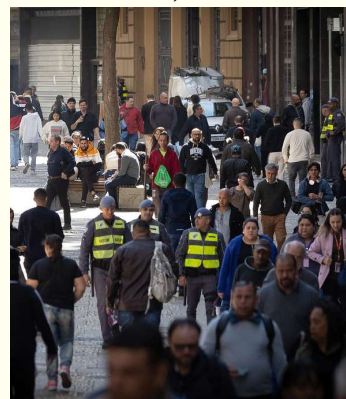
Queda foi de 19,7% em relação a 2023