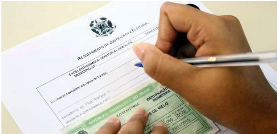
Justificativa precisa ser feita até o dia 5 de dezembro; ausência de eleitores no município de Marília representou 26,38%

Em 2020, esses números também foram maiores do que no último dia 6 de outubro. Escolheram o voto branco 6.849 eleitores e 9.699 anularam, o que na época retratou mais de 13% dos votos em Marília. Já as abstenções somaram 29,73%, com 53.185