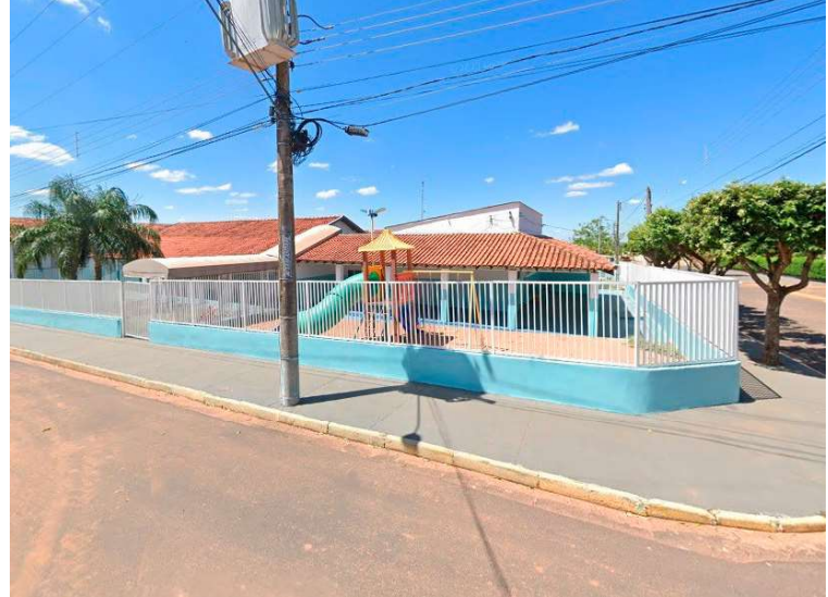
Prefeitura declara que Emei não consegue atender demanda da rede municipal

Ainda de acordo com o Executivo, a escola tem nove salas de aula, com capacidade máxima para 20 alunos cada, totalizando 180 estudantes no atendimento em período integral. A prefeitura reconhece que a demanda atual da unidade está em 258 crianças. Ou seja, 78 delas não têm acesso a salas disponíveis para serem matriculadas. Apesar da urgência declarada na justifica-