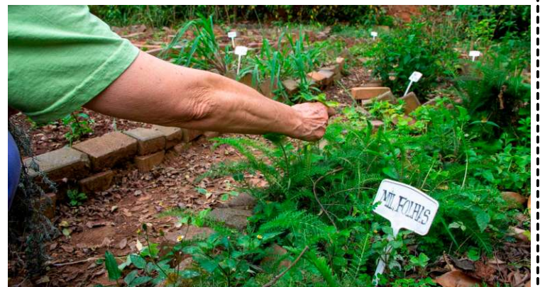
Acordo fortalece a produção da agricultura familiar no estado de São Paulo