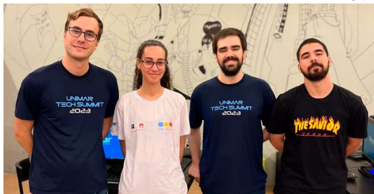
Dois alunos foram contemplados pelo Pibit e um pelo Pibic; projetos são destaques