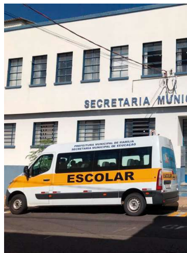
Secretaria abre novo processo milionário