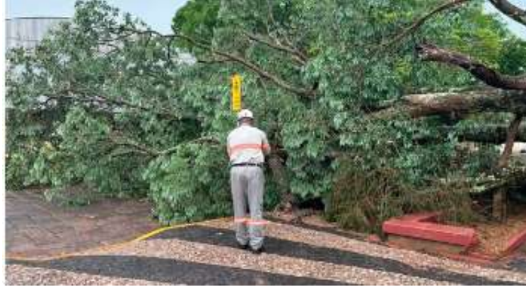
Temporal atingiu todos os municípios da região; Vera Cruz registrou queda de árvores

A situação disparou um alerta sobre a necessidade de ampliar as medidas de prevenção e orientação para a população