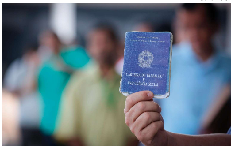
Marília ainda ficou entre as 20 cidades com maior geração de emprego em agosto