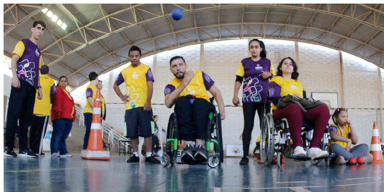
Programa criado em 2021 capacita educadores físicos para promover a integração