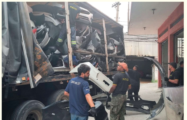
No dia 3, foram localizadas mais de 8.400 peças na capital sendo vendidas ilegalmente