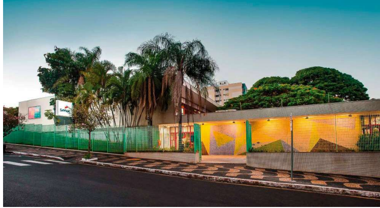
Destaques na programação incluem oficinas de skin care e customização de camisetas

O Casa Aberta Senac é realizado de forma simultânea em 63 unidades da instituição no estado de São Paulo. Em Marília, serão mais de mais de 30 atividades com temas que envolvem as áreas do conhecimento ofertadas: Beleza, Comunicação e Artes, Desenvolvimento Social, Design e Arquitetura, Gastronomia e Nutrição, Ges-