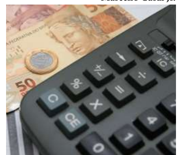
Números divulgados nesta semana