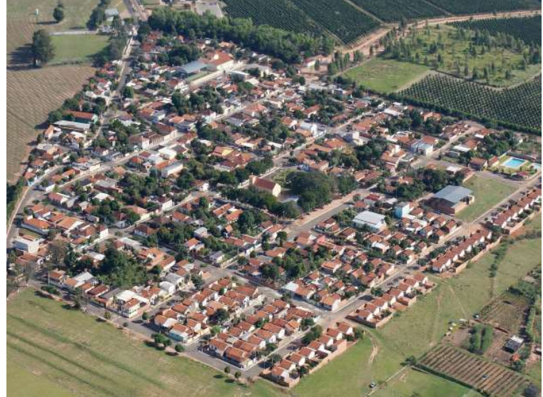
Vista do distrito de Santa Terezinha, em Lupércio; Orçamento de 2025 é maior