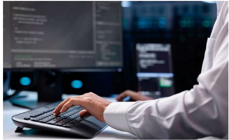
Trabalhador durante expediente; Ocaçu quer modernizar equipamentos