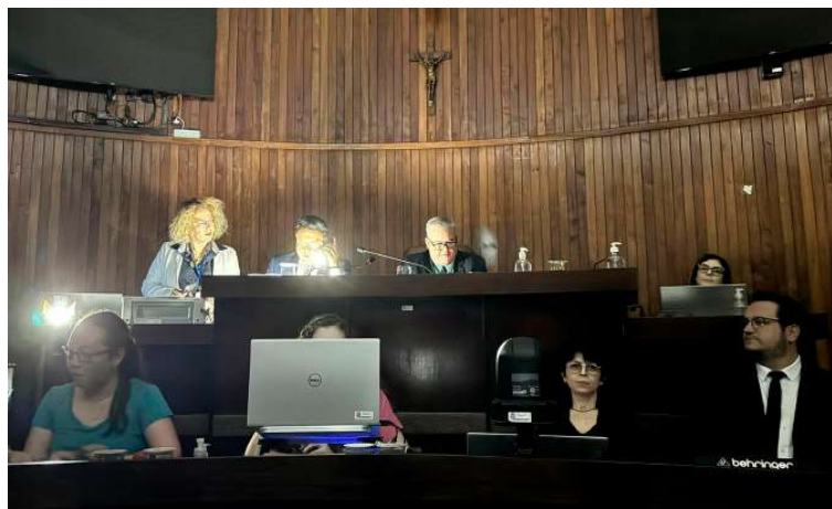
Sessão ocorreu sem energia na 1ª hora, o que impediu a transmissão pela TV Câmara