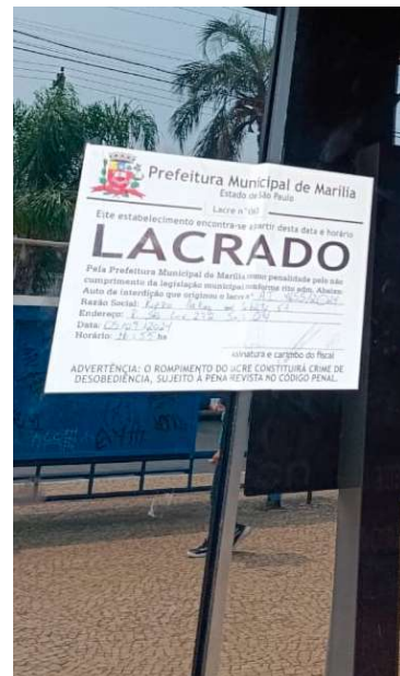
Escritório da Rizzo continua lacrado