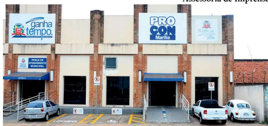
Arrecadação neste ano com o IPTU chegou a R$ 84,1 milhões em Marília