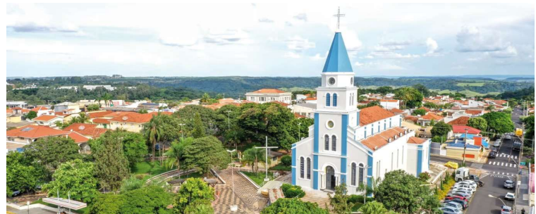
Vista de Pompeia, cidade que conta com 8,9 mil domicílios, segundo dados do Censo