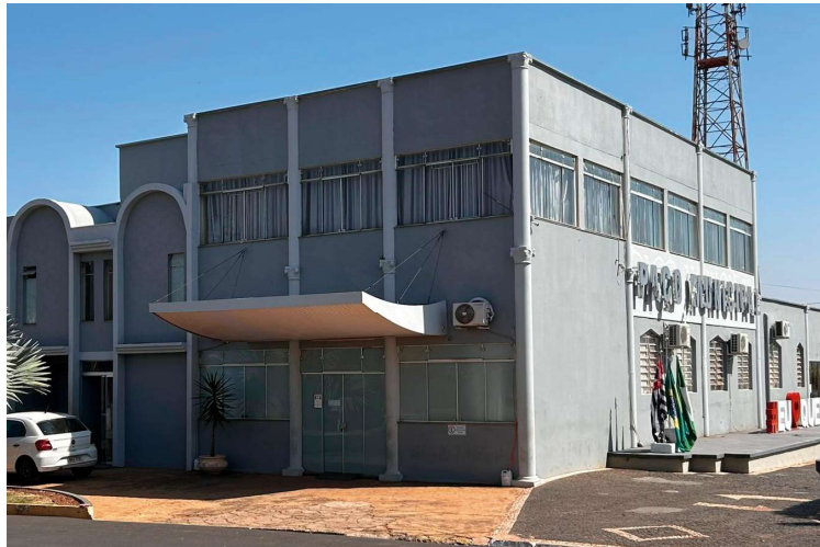
A Prefeitura de Queiroz foi uma das 2.474 que contou com reeleição em 2024

De acordo com a pesquisa feita pela CNM (Confederação Nacional de Municípios), a cada dez candidatos que tentaram a recolocação, oito obtiveram êxito (81%). Dos 3.006 que declararam concorrer à reeleição, 2.444 já obti-