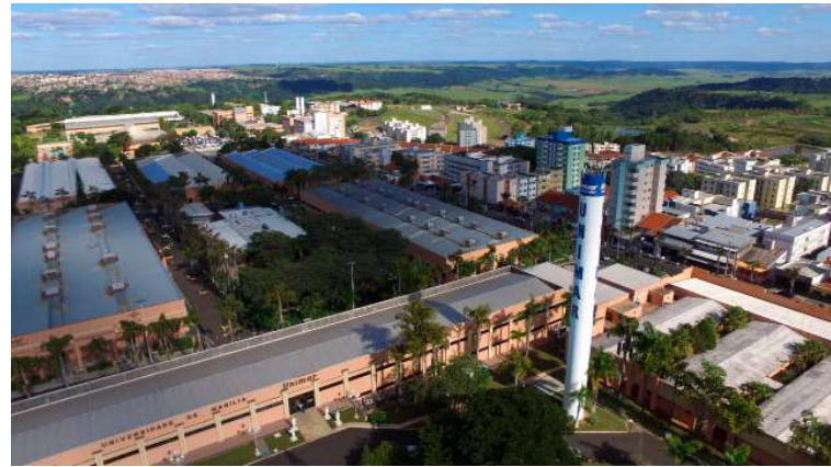
Evento é realizado através de importantes parcerias firmadas pela Unimar