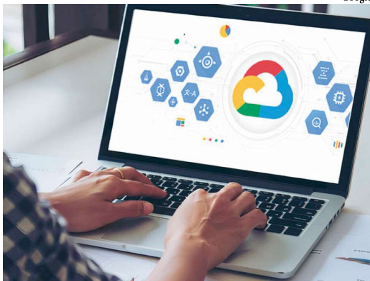
Participantes poderão receber selos que comprovam o domínio em uma habilidade

A aprendizagem é oferecida gratuitamente pelo Google Cloud, que tem um conjunto de serviços em nuvem com temas relevantes, como: liderança digital, inteligência artificial, computação em nuvem, engenharia de nuvem, cibersegurança e ciência de dados. Após