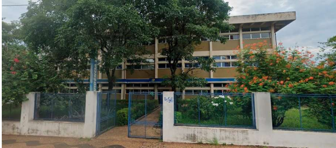
Fachada do INSS de Marília; os atendimentos continuarão nas centrais de atendimento do Instituto Nacional de Seguro Social

No atendimento, um funcionário dos Correios poderá auxiliar no requerimento via Atestmed, que é o serviço on-line do INSS, sem passar pela perícia médica presencial.