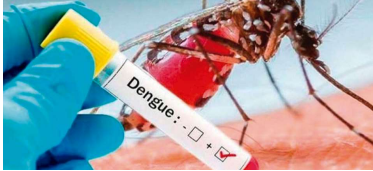
Casos positivos de dengue em Marília passam de 9 mil e cidade entra em alerta

Com mais estas duas mortes, o total deste ano sobe para 17, seguindo a metodologia estabelecida pelo Estado para fins de estatística. A prefeitura não contabiliza como