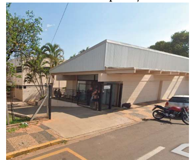
Caps funciona com outros serviços do HC