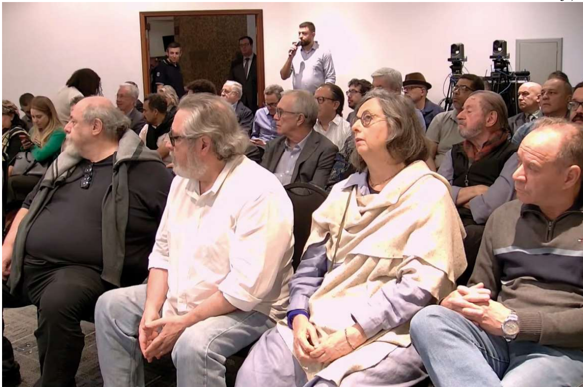
Evento foi realizado no último dia 8 de outubro, em São Paulo, e reuniu autoridades; secretário de Alvinlândia foi um dos apoiadores

“Foi uma homenagem que achamos necessária para que as pessoas conhecessem quem foi Franco Montoro, sua forma de trabalho e fatores desconhecidos pela população mais jovem do homem