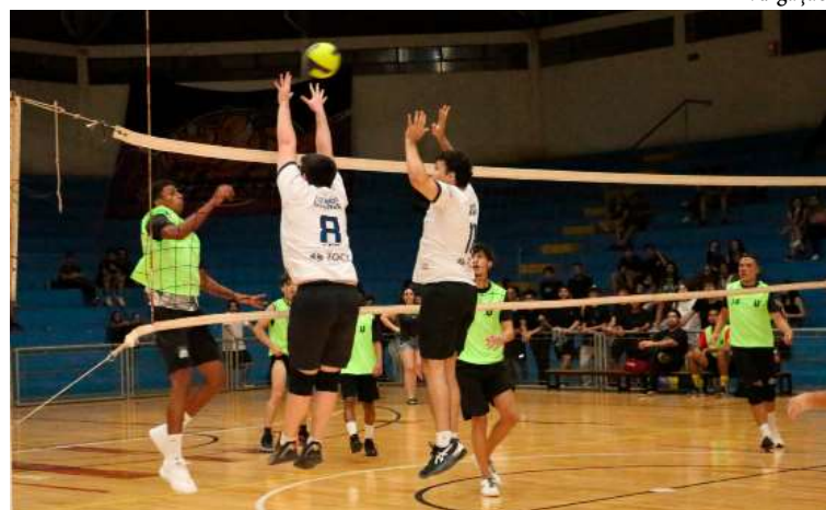
Jogos das Olimpíadas Universitárias da Unimar reuniram 200 participantes