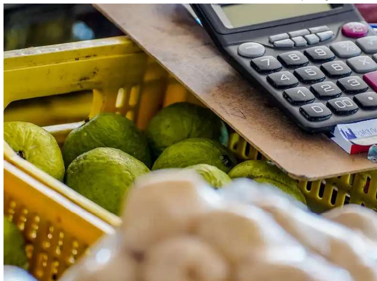
Registro de preços prevê aquisição de diversos tipos de alimentos em Lupércio