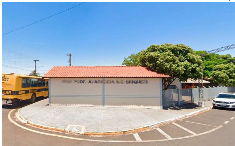
Escola de Ensino Infantil de Ubirajara; prestação de contas da Educação é realizada