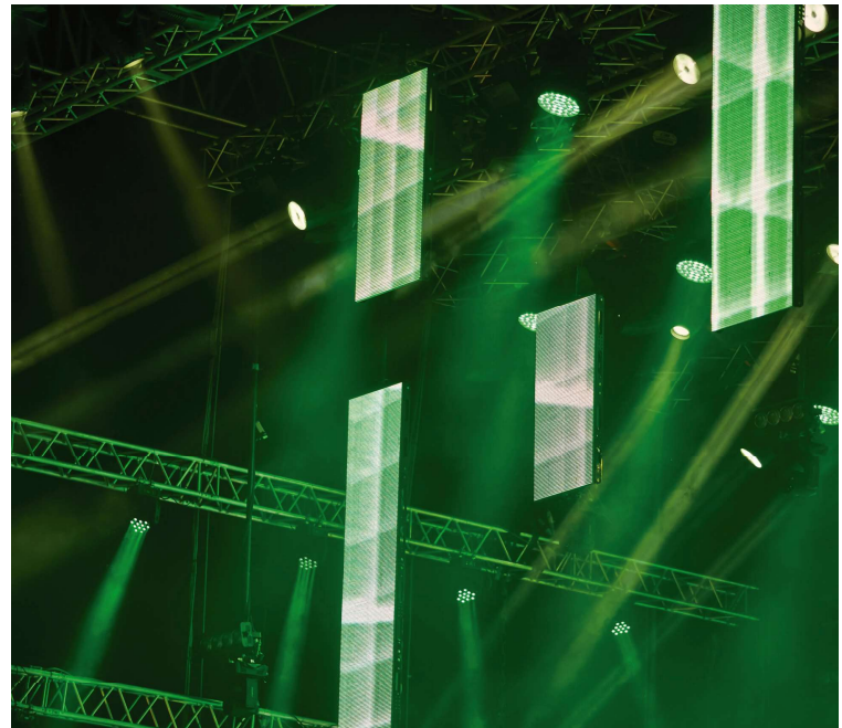
Registro de preços tem como objetivo a locação de equipamentos para eventos