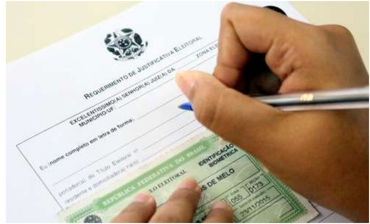
Nas Eleições Municipais de 2020 mais de 8 mil justificaram o voto em Marília