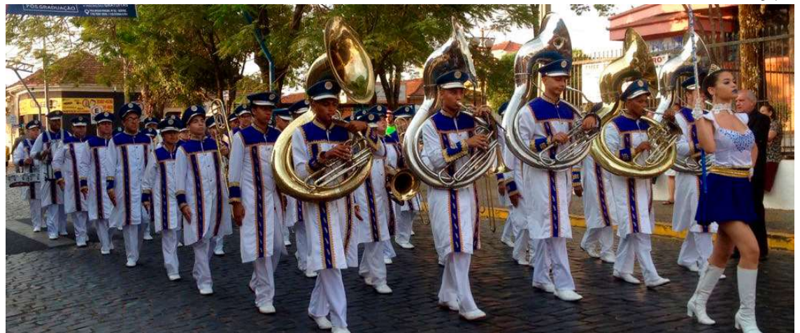
Banda Marcial existe desde o ano de 1995 na cidade de Marília e hoje conta com 30 integrantes; edital visa renovar instrumentos