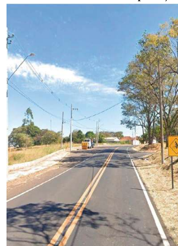
Estrada onde ficará a nova ciclovia