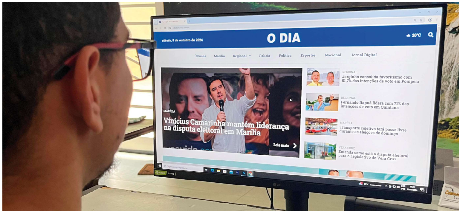
Com novo portal, o jornal O DIA acompanha os resultados das eleições municipais em todas as cidades da região em parceria com a Jovem Pan Marília, que também terá edição especial