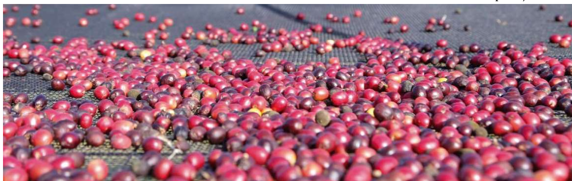
Região de Marília é uma das mais importantes produtoras de café do estado de SP; pesquisa revela perfil de consumo