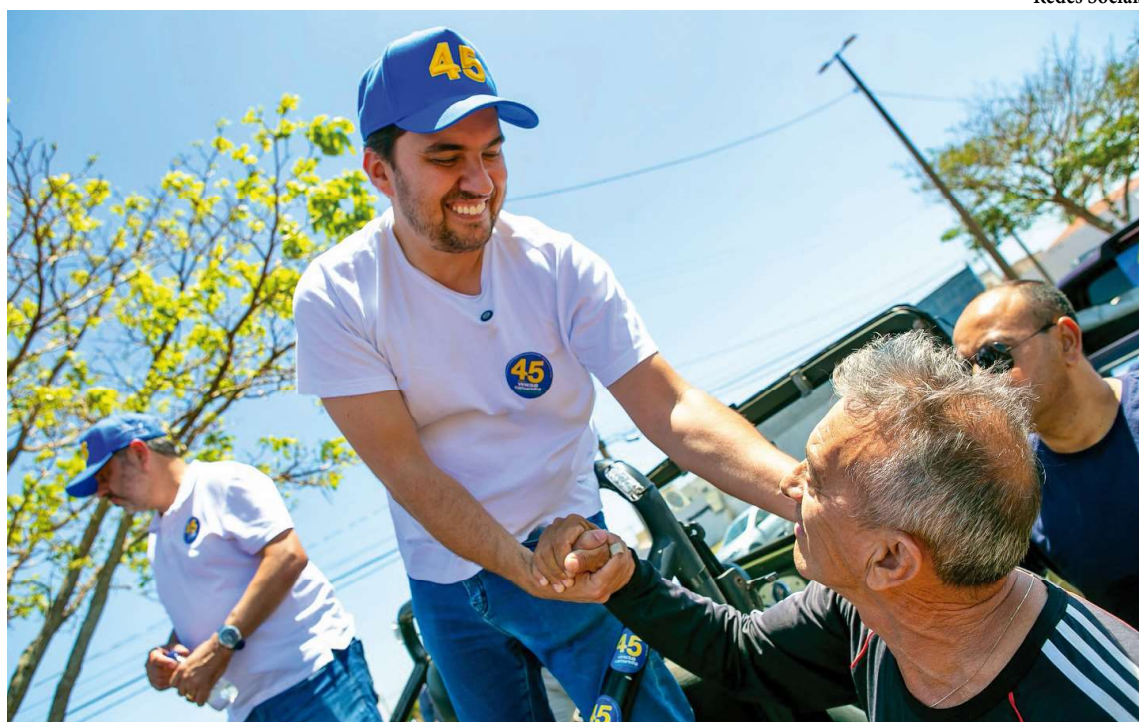
Prefeito eleito, Vinicius fala sobre ações prioritárias de seu governo, foco na Saúde e suspensão das atividades dos radares em Marília