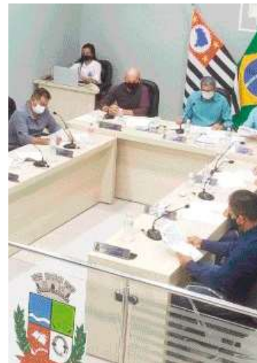
Atual formação da Câmara de Quintana