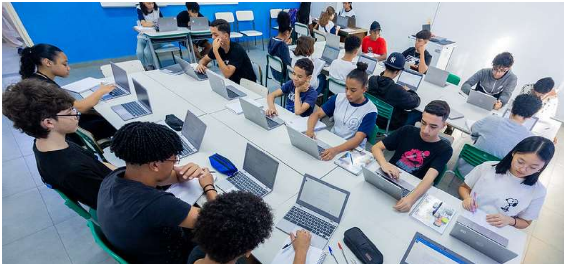
Novas gerações são um desafio para o ensino nas escolas técnicas que mantêm-se atualizadas sobre as novidades do mercado

Estar alinhado ao que acontece no mercado de trabalho é outro diferencial apontado do CPS. Ainda segundo a assesso-