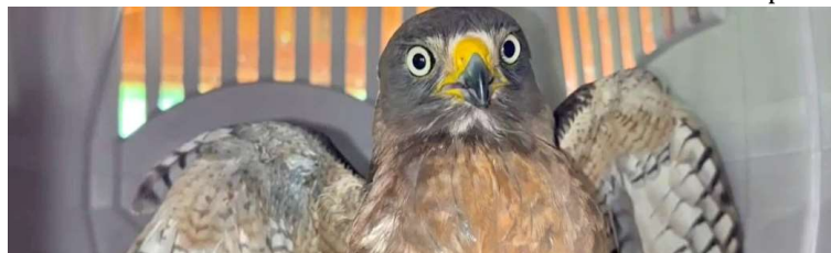
Maior parte das aves recebidas pela associação chegaram intoxicadas e receberam tratamento