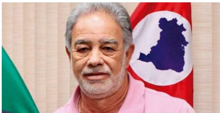
Atual prefeito conseguiu se eleger com diferença de apenas 21 votos; confira plano de governo