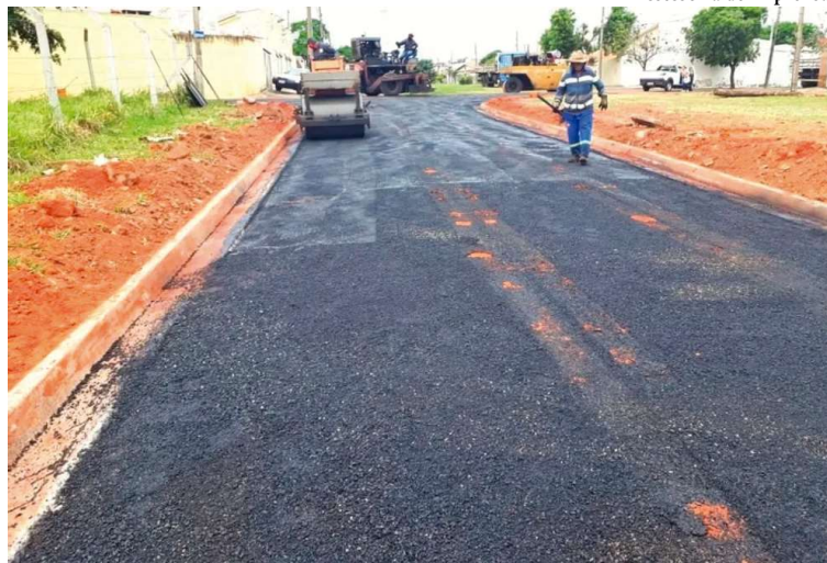
Processo licitatório eletrônico está marcado para ser realizado no próximo dia 30 de outubro

Pregão prevê a contratação de empresa para realizar o recapeamento e pavimentação asfáltica de vias P3