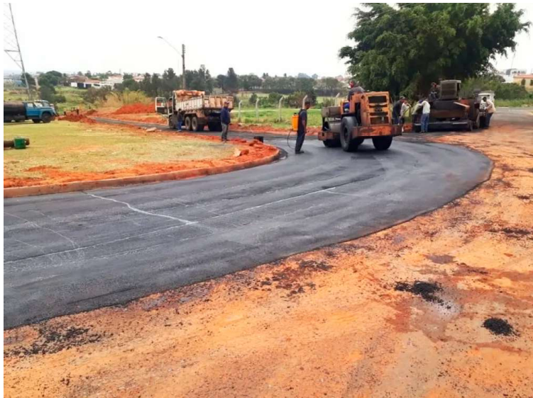
Registro de pavimentação antiga; novo edital tem custo estimado em R$ 4,7 milhões

Segundo argumentos apresentados pela Secretaria de Obras Públicas, foram levantadas duas possibilidades de solução para o estado das ruas: retirada de toda a pavimentação e execução em concreto com valor estimado de R$ 6.602.892,05, e a opção pelo recape e pavimentação com CBUQ (Concreto Betuminoso Usinado a Quente), um tipo de asfalto que é utilizado para pavimentar estradas e rodovias, no valor do edital, que se mostrou “mais vantajosa sob os aspectos da conveniência, economicidade e eficiência. Leva-se em conta também a facilidade de manutenção em caso de necessidade e eventuais reparos em rede de drenagem, água e esgoto”.