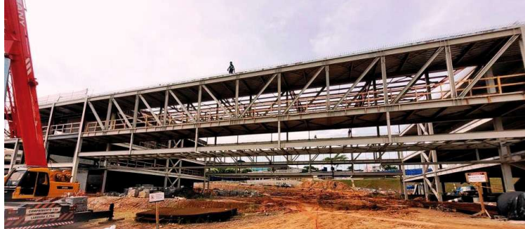
As obras para conclusão da unidade do Sesc em Marília seguem cronograma

Localizada entre as ruas Pedro Serem e Antônio Galina, anexo ao Jardim Portal do Sol, na zona Sul da cidade, a nova unidade do Sesc