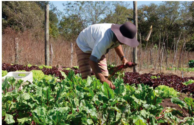
Região de Marília se destaca no Estado de SP pela força da agricultura familiar

Essas propriedades são responsáveis por 23% do valor bruto da produção agropecuária do país e por 67% das ocupações no campo. São 10,1 milhões de trabalhadores na atividade. Desses, 46,6% estão no Nordeste. Em seguida, aparecem o Sudeste (16,5%), Sul (16%), Norte