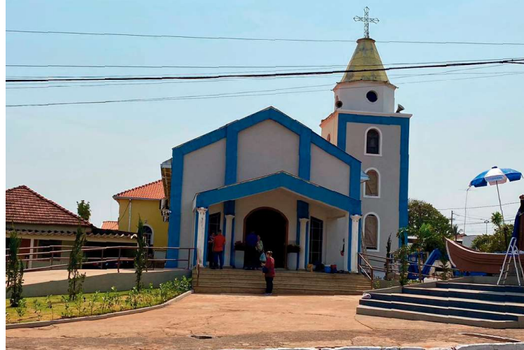
Igreja Matriz de Queiroz é preparada para a missa campal no próximo sábado

A partir das 8h, uma carreta será formada em Macucos, distrito de Getulina, que seguirá até Queiroz em comemoração ao dia da Santa. Às 9h, está programada uma missa campal, em frente à Igreja Matriz, que termi-