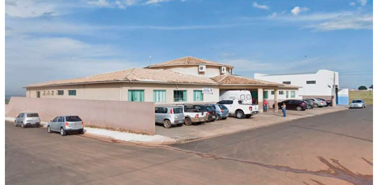
Centro de Saúde de Alvinlândia; prefeitura alega falta de entrega de medicamentos

Já o registro de preços que será firmado perto do final do mês inclui uma lista com quase 200 medicamentos. A justificativa é embasada na necessidade devido à ausência de entrega por parte da empresa licitante contratada anteriormente e de novas demandas que apareceram. Segundo a administração muni-