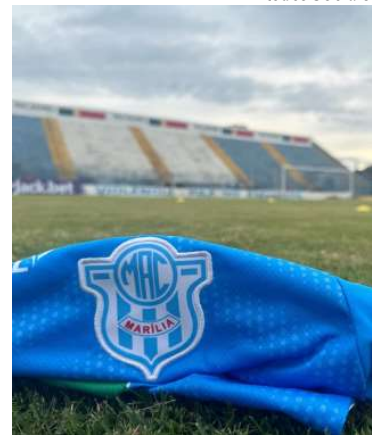
Marília será sede da Copinha em 2025

Valor da publicação: R$ 26,88. Conforme Lei Municipal Nº 2.650, de 30 de março de 2016