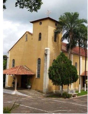
Recursos serão usados na obra da capela