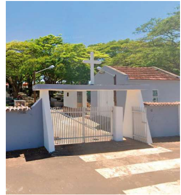
Pessoas de baixa renda receberão apoio