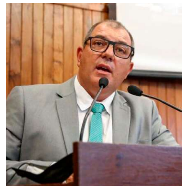
Jurídico da Câmara defende regularidade