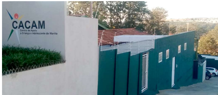
A Prefeitura de Marília prorrogou contratos com o Cacam para atendimento de crianças

ações de autoria do Ministério Público que determinaram o fornecimento de transporte para as crianças atendidas pelo Cacam, além da atualização dos valores repassados para o centro de acolhimento. Em matéria publicada em 27 de julho pelo jornal, o advogado da entidade informou que o atendimento