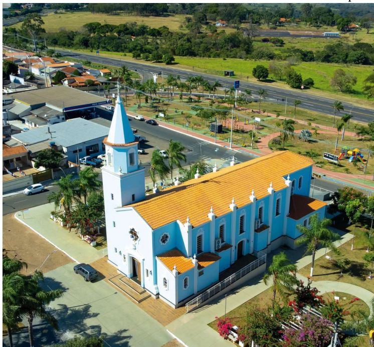
Quintana é destaque em pesquisa nacional sobre o uso eficiente de recursos públicos

MAIS /Além da Festa de Peão, município terá o “Quintana Verão”, que contará com show do cantor Paulo Ricardo no Calçadão, e a Grande Virada. Um pouco antes, em 14 de dezembro, criançada poderá se divertir com a chegada do Papai Noel e distribuição de presentes. Durante o “Quintana Verão” e a Virada ainda será disponibilizada gratuitamente a Roda Gigante.