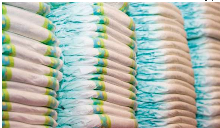
Objetivo da licitação é atender às demandas judiciais de pacientes do município

“A aquisição de fraldas para distribuição nas Unidades Básicas de Saúde (UBS) do município de Herculândia - SP é uma medida essencial para assegurar que os pacientes atendidos recebam os cuidados adequados, especialmente aqueles com necessidades especiais ou condições de saúde