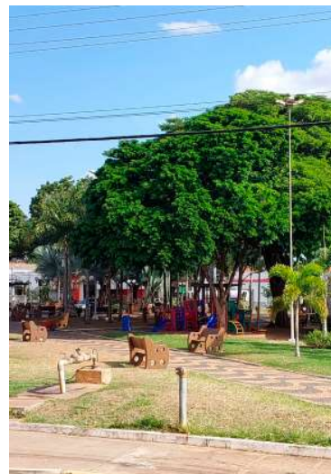
Município faz aniversário no sábado

Valor da publicação: R$ 26,88. Conforme Lei Municipal Nº 2.650, de 30 de março de 2016