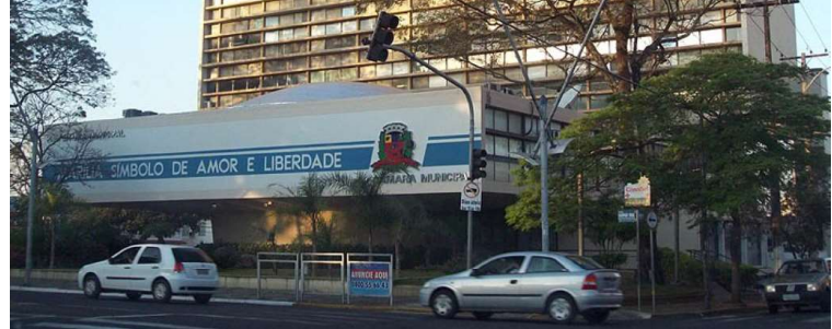
Prefeitura retoma pavimentação de avenida em Lácio, após nova decisão judicial