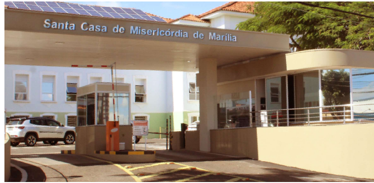
Santa Casa de Marília realiza serviço de captação de órgãos e tecidos desde 2004