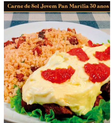
Jovem Pan Marília foi homenageada