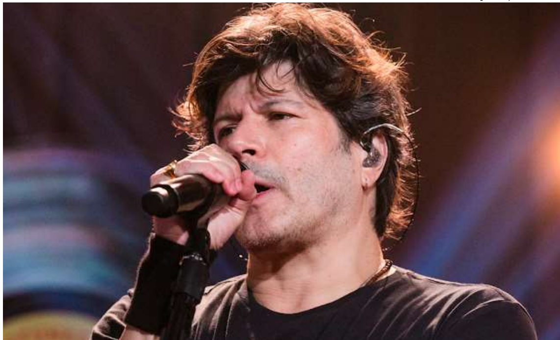
Cantor Paulo Ricardo, ex-vocalista da banda RPM, conta com público fiel; evento gratuito fomenta a economia do município

A pasta ressalta ainda que o evento colabora para a geração de renda e empregos temporários, que vão desde atuação na organização e montagem da estrutura