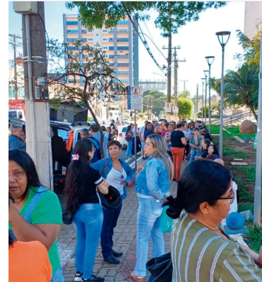
Grupo de merendeiras durante protesto