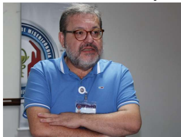
Superintendente realiza declarações

Um plano de contingência também foi montado para atender