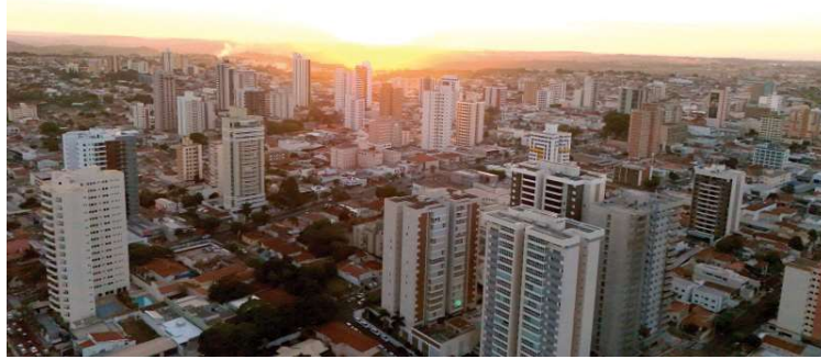
Marília foi destaque em alguns setores, com melhor colocação em agropecuária

A posição de maior relevância foi obtida por Marília em agropecuária, como a 15ª para se investir no setor, com nota 0,01261. Entre os indicadores