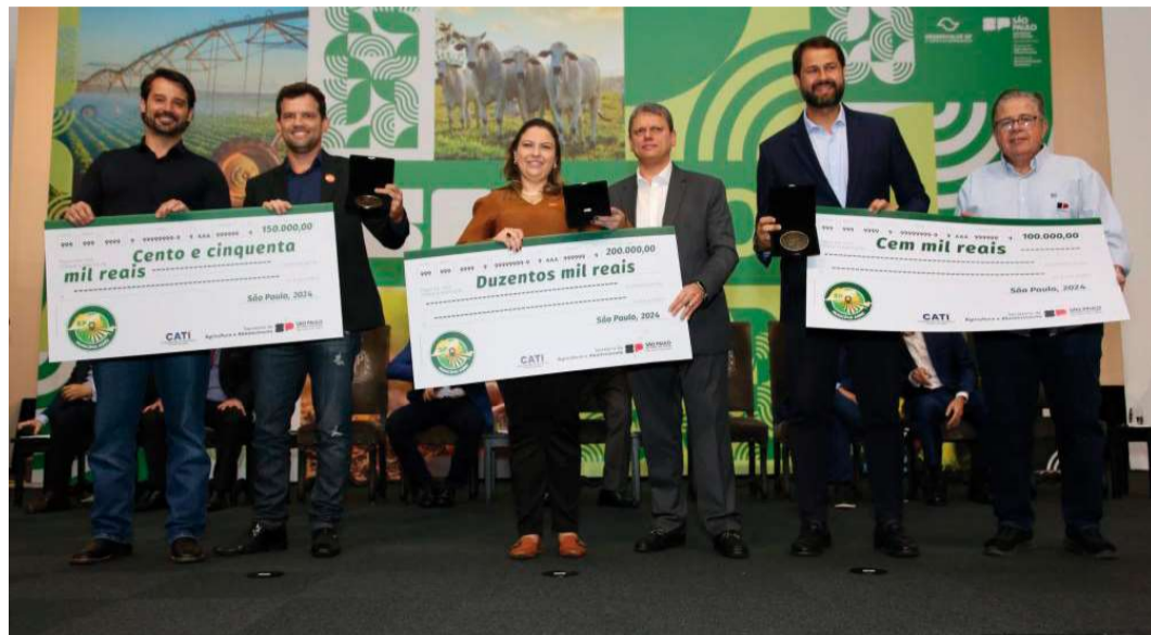
Municípios melhores colocados chegaram a receber premiação de R$ 200 mil

Neste ciclo, 251 municípios participaram da disputa, sendo 117 ranqueados e certificados pelas boas práticas e promoção da agricultura paulista. Eles foram avaliados de acordo com critérios técnicos, onde mais de 60% da pontuação é decorrente de atividades de gestão, no âmbito do desenvolvimento e da implantação de ações para o agronegócio. “A parceria entre município e Estado hoje está cada vez mais fortale-