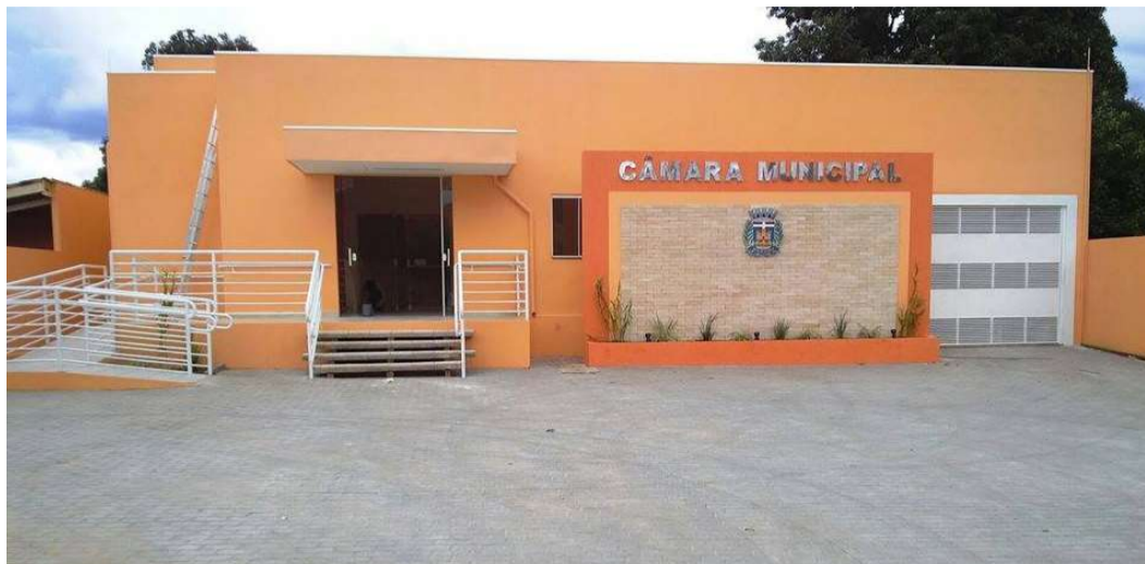
Câmara de Ocaçu; Orçamento para 2025 foi aprovado em duas votações na Casa

Segundo a lei municipal nº 2.119, a maior parte das receitas é proveniente de transferências correntes (R$ 38 milhões), seguidas das tributárias (R$ 4,6 milhões) e de serviços (R$ 1 milhão). De deduções da receita corrente são R$ 5,6 milhões. O projeto do Orçamento foi apresentado ao Legislativo de Ocaçu no fim de agosto.