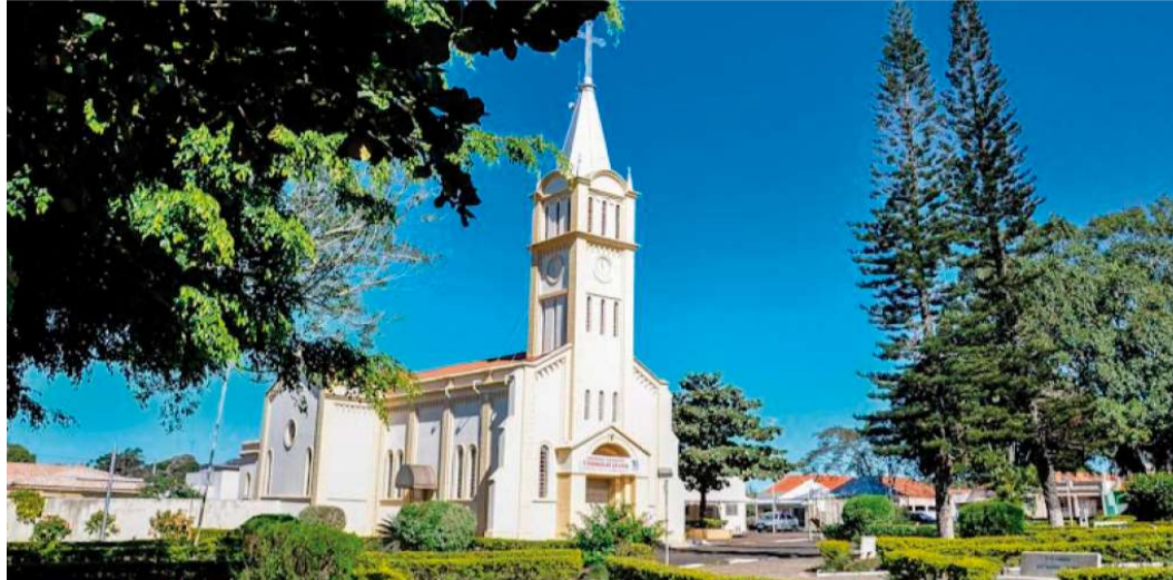
Vista da cidade; educação e saúde são as áreas com maior valor no orçamento de 2025

Quando os gastos são separados por função de governo, a Educação ficará com o maior valor, fixado em R$ 8,3 milhões. Saúde,