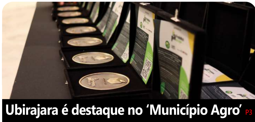
Ubirajara é destaque no 'Município Agro' P3