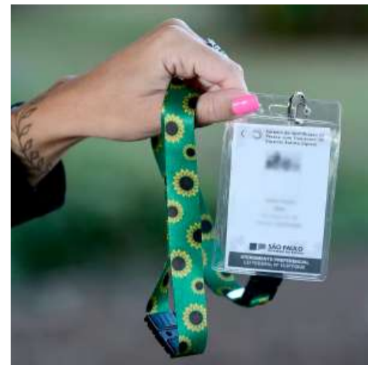
Carteira da Pessoa Autista; cidade avança