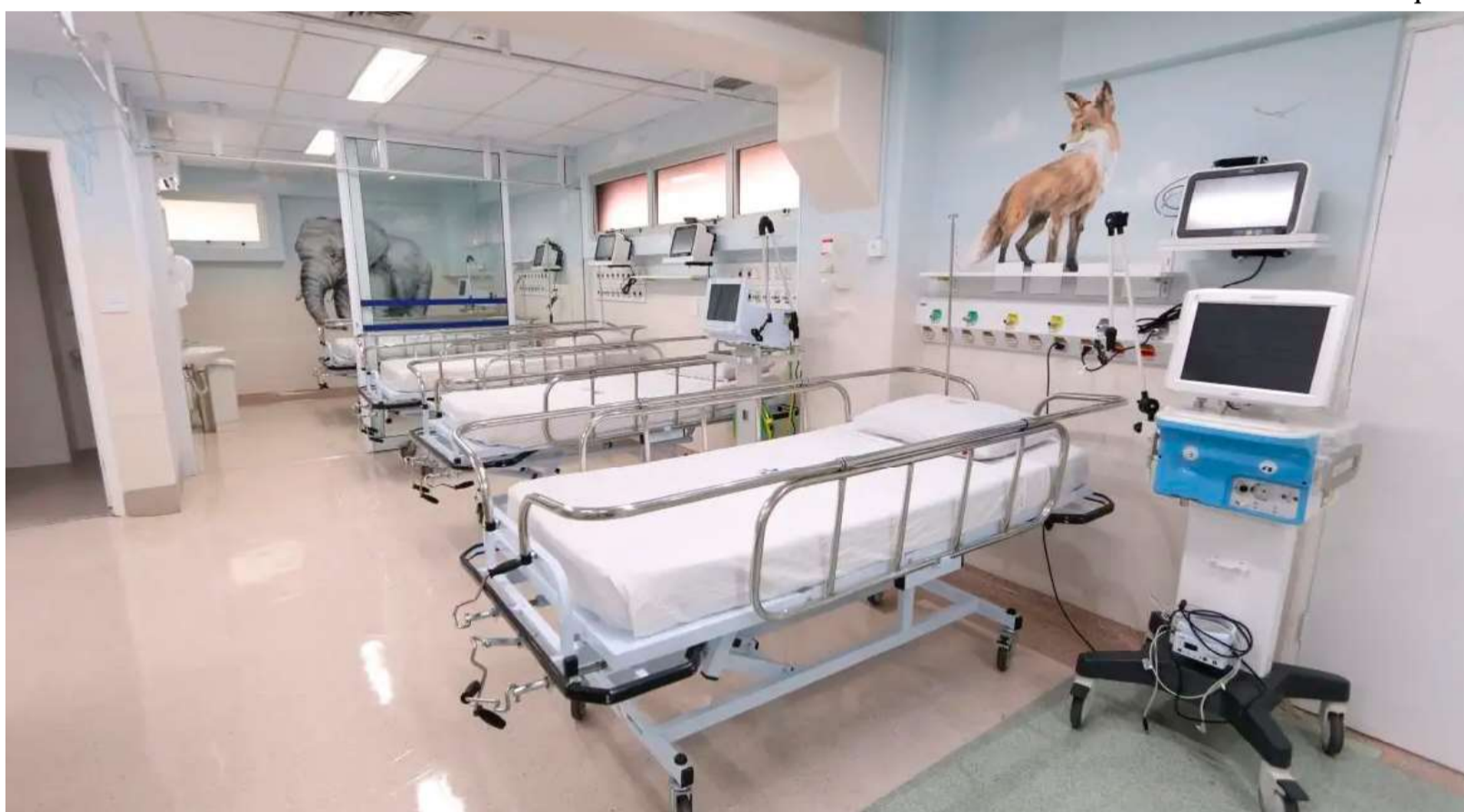
Portaria publicada no dia 6 de dezembro, no Diário Oficial da União, oficializou a conquista; atendimento reforçado

GOVERNO DE QUINTANA, PROMOVENDO A GERAÇÃO DE EMPREGO E RENDA!