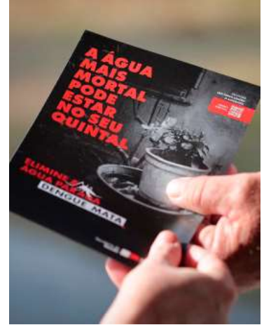
Cidade receberá mais de R$ 1,2 milhão