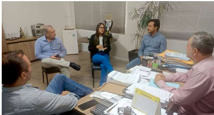
Assessoria de Imprensa

Segundo a administração municipal, existe um esforço para garantir a legalização das áreas. "É mais um passo para promover a tranquilidade e segurança aos empreendedores ali instalados", divulgou pelas redes sociais. "A iniciativa refor-