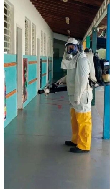
Escolas estão entre locais de aplicação