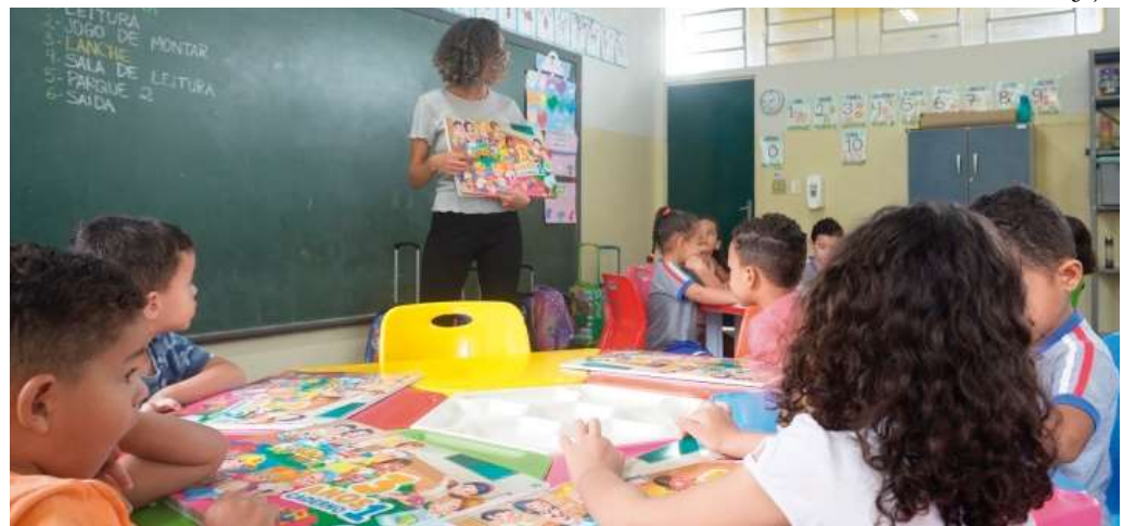
Quase 500 estudantes do ensino fundamental e 273 alunos do ensino infantil devem retomar as atividades nas escolas