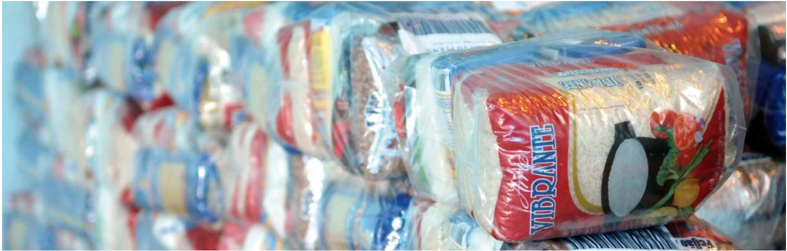
Golpistas se passam por representantes de uma casa de assistência a idosos da cidade para distribuir os supostos donativos; a reportagem do O DIA conversou com uma das vítimas