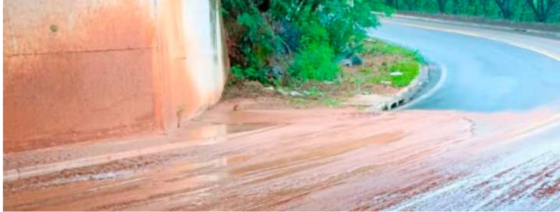
Deslizamento de terra em viaduto na região Oeste motivou presença de agentes de trânsito para regularizar situação

De acordo com informações da administração municipal, no viaduto de acesso ao Marília Shopping, na região Oeste, houve um deslizamento de terra, sendo necessária a presença de agentes de trânsito para orientação aos motoristas e motociclistas que trafegavam pelo local. Alguns semáforos apresentaram defeito e a equipe técnica da Emdurb realizou a manutenção imediata em todos