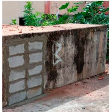
Caixas d'água abandonadas são fechadas

tas para que o inseticida possa ter o efeito esperado.