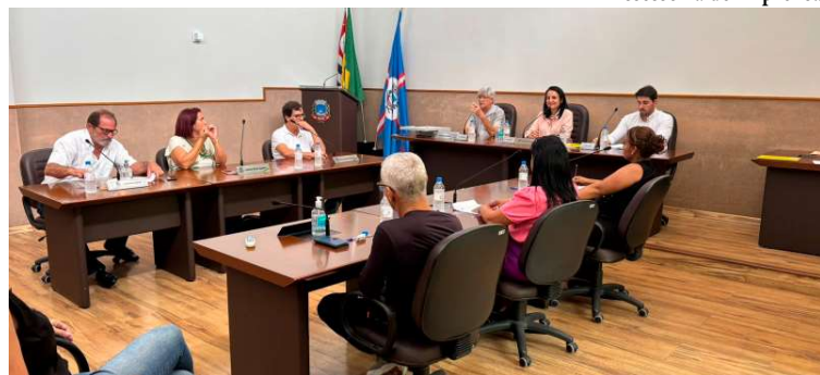
Reajuste para os servidores municipais foi aprovado durante sessão extraordinária