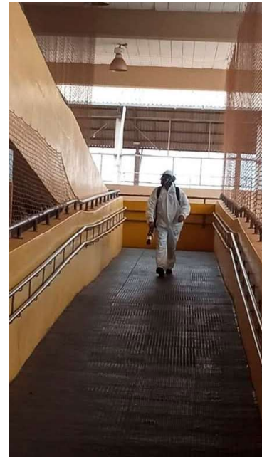
Agentes continuam passando por bairros