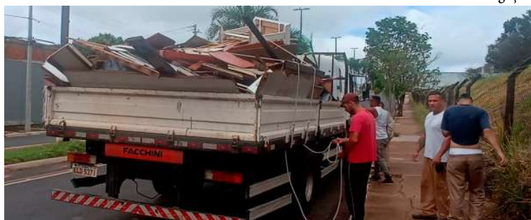
Operação passou pelo bairro JK na semana passada e agora passa pela zona Sul