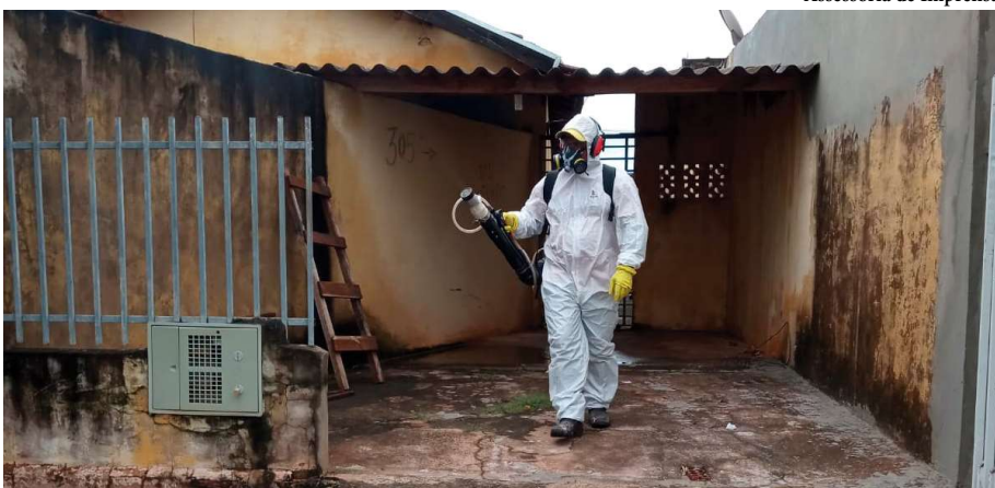
Nebulização é realizada em residências e prédios públicos, bem como bloqueios e controle de criadouros