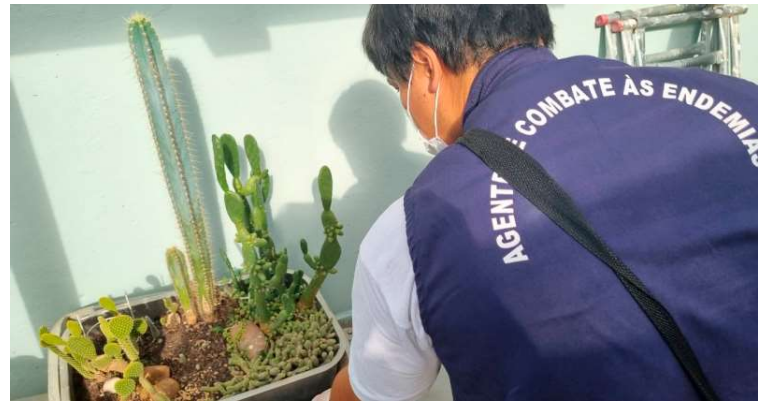
Ações de fiscalização, nebulização e limpeza visam combater os criadouros