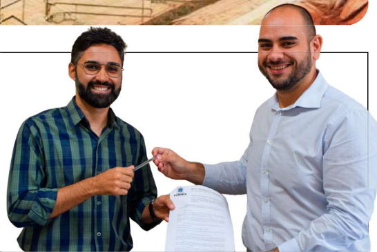
Assessoria de Imprensa