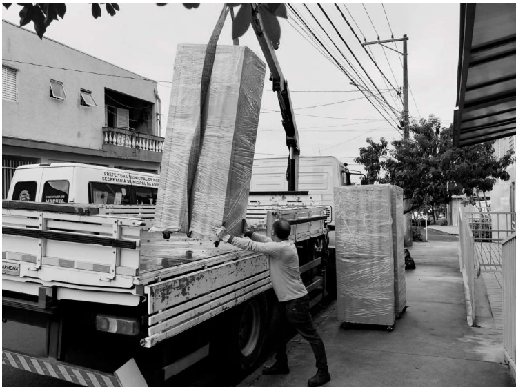
Câmaras de conservação de vacinas foram instaladas em 12 unidades de saúde