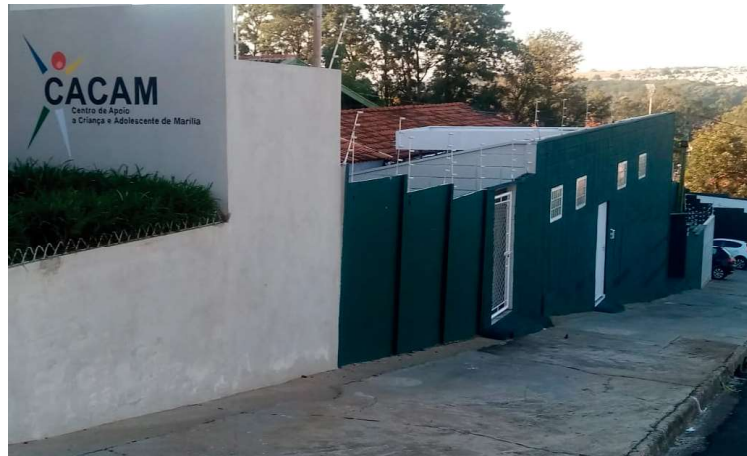
Contratos com o Cacam estão prorrogados até dezembro de 2025; entidade é absolvida

INTERVENÇÃO / A Portaria nº 44.352, de 22 de maio de 2024, instaurou o processo administrativo punitivo contra o Cacam e determinou a atuação de um interventor na gestão da instituição, até que o procedimento fosse concluído. Inicialmente, este processo teria duração de 180 dias, mas ganhou ao menos duas prorrogações e somente agora chegou ao fim.