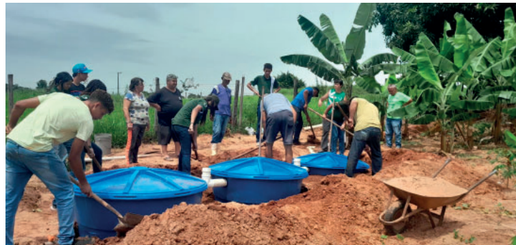
Cursos vão capacitar produtores sobre tratamento de esgoto na zona rural

O Jardim Filtrante trata as chamadas águas cinzas, que são