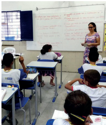
Repasse foi oficializado por portaria

Educação de expandir gradualmente a oferta de educação integral em todo o país. Segundo as normas do MEC, a distribuição dos recursos considera a evolução de ma-