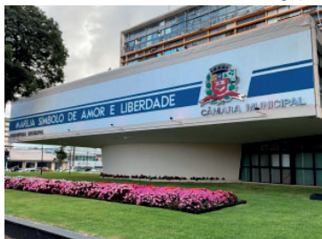
Projeto será encaminhado à Câmara

Segundo a administração, a proposta permitirá a regularização dos pontos já existentes, garantindo a manutenção de empregos e geração de renda, além de trazer segurança jurídica para os empreendedores que atuam de boa-fé. A iniciativa também busca disciplinar o uso de espaços públicos, equilibrando o interesse coletivo e a exploração econômica de forma fiscalizada pelo poder público.