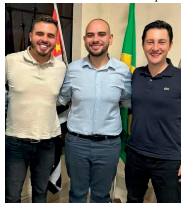
Prefeito Ceschim recebeu o deputado