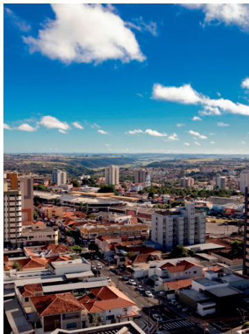
Vista Marília; cidade está entre melhores

Em sua sexta edição, o Ranking de Competitividade dos Municípios busca avaliar como as cidades brasileiras estruturam políticas públicas capazes de gerar desenvolvimento,