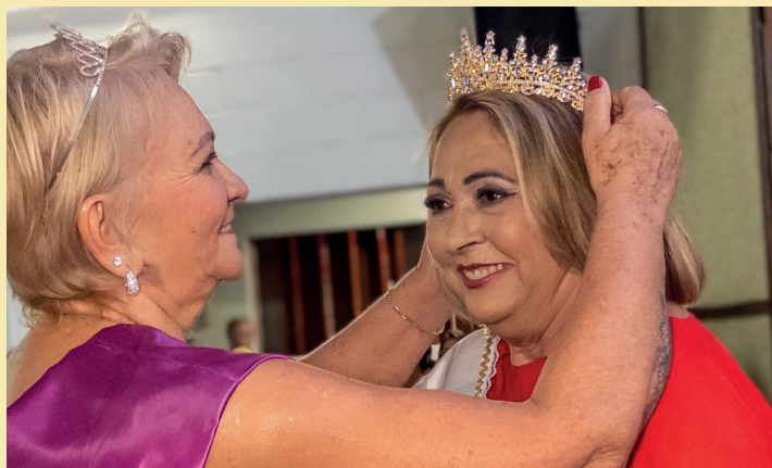
Miss Terceira Idade 2025 foi coroada em cerimônia realizada no último sábado