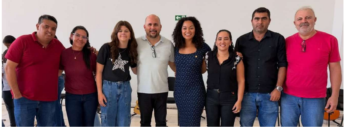
Durante a visita, a parlamentar também conheceu as iniciativas do Projeto de Violão e a Academia Municipal de Queiroz

Com o novo repasse, o total de recursos destinados pela