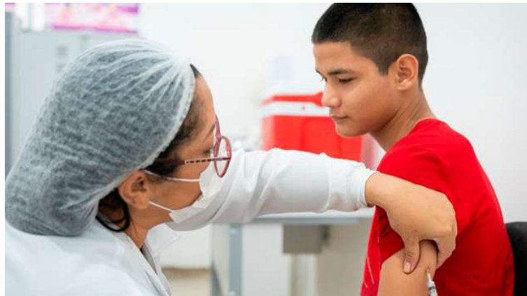
Objetivo é reforçar financiamento da Atenção Especializada no Sistema Único de Saúde

A Portaria GM/MS nº 9.412 autoriza a liberação de recursos a diversos estados e municípios em todo o país, totalizando mais