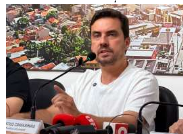
Prefeito realizou coletiva de imprensa

Valor da publicação: R$ 15,68. Conforme Lei Municipal Nº 2.650, de 30 de março de 2016