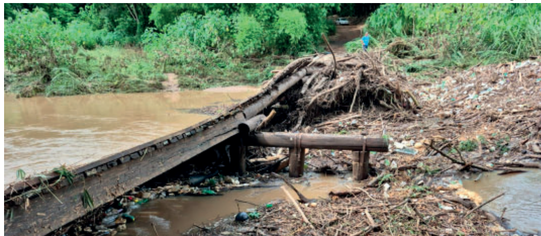
Elevação do nível do rio do Peixe provocou acúmulo de galhos, troncos e materiais

Valor da publicação: R$ 26,88. Conforme Lei Municipal Nº 2.650, de 30 de março de 2016