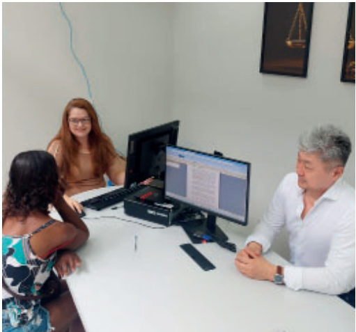
Parceria garantiu criação da iniciativa