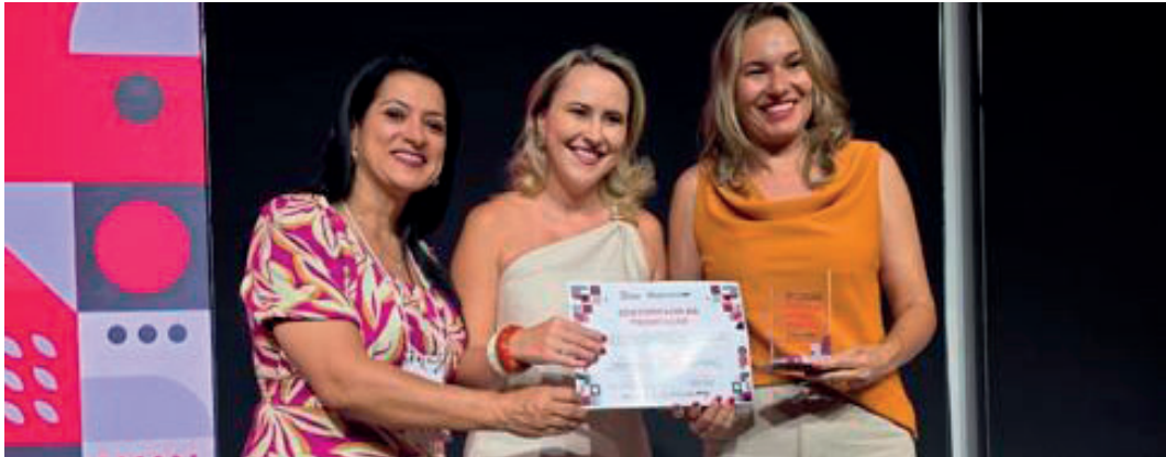
Premiação foi entregue nesta sexta-feira, em cerimônia realizada na capital paulista

Implantado no início da atual gestão, o Programa Alfabetiza