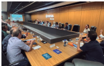
Autoridades na 10ª reunião de secretariado