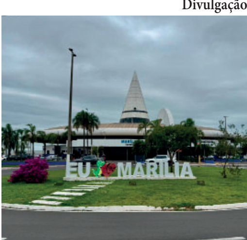
Rodoviária recebeu melhorias estruturais

Alves, o conjunto de ações proporciona mais segurança e conforto aos usuários. “A Rodoviária voltou a ser um dos principais cartões-postais da nossa cidade”, afirmou. Também foi implantado um novo sistema de iluminação em LED, abrangendo pontos estratégicos do terminal e o mirante, garantindo maior visibilidade ao local. Em parceria com a Code-mar, foram realizados reparos na camada asfáltica das plataformas. As reformas nos banheiros incluíram a instalação de portas e novos mictórios, inclusive nos sanitários com acessibilidade, além de melhorias nas calçadas, aumentando a segurança dos pedestres. Paulo Alves destacou ainda que a atual gestão encontrou a Rodoviária em estado precário, com