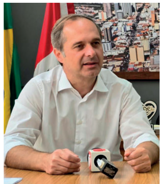
Presidente comentou balanço da Câmara