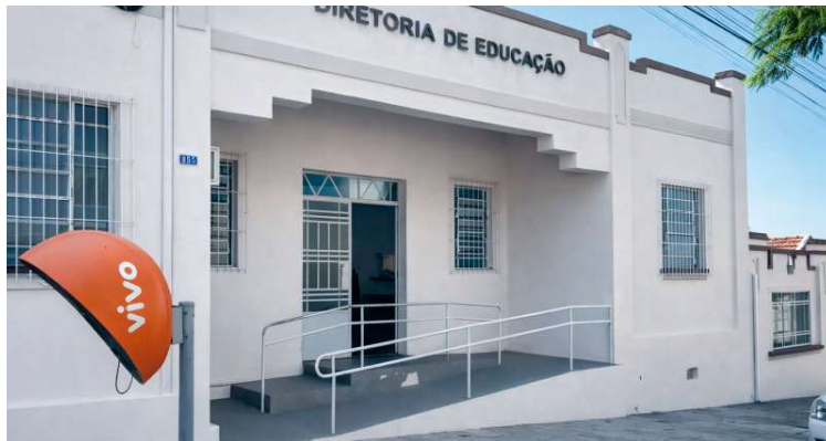
Inscrições devem ser realizadas na Diretoria Municipal de Educação de Vera Cruz

Todos os cargos têm jornada de oito horas diárias. O salário base é de R$ 1.518,67 para ajudante geral e servente, e de R$ 1.959,36 para operador de máquinas. Para concorrer, é exigido ensino fundamental completo. No caso de operador